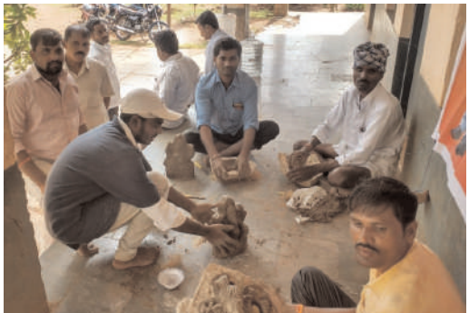
నీలగిరి వార్త వికారాబాద్ జిల్లా ప్రతినిధి

వికారాబాద్ జిల్లా లోని కుమ్మరి కులవృత్తుల వారిని ప్రోత్సహించడానికి పర్యావరణాన్ని పరిరక్షించడానికి మట్టి గణపతులను పూజించాలని జిల్లా వెనుకబడిన తరగతుల అభివృద్ధి అధికారి కుంభం, ఉమ్మెండర్ ఒక ప్రకటనలో తెలిపారు. వికారాబాద్ జిల్లా వెనుకబడిన తరగతుల అభివృద్ధి కార్యాలయం నుండి శిక్షణ పొందిన కుమ్మరుల వద్ద నుండి మట్టి గణపతులు విక్రయించాలని తెలియ జేశారు. మట్టి గణ పతులు కావలసిన వారు వీరిని సంప్రదించగలరు వికారాబాద్ నియోజక వర్గం లో కుమ్మరి అంజలియ్య ఫోన్