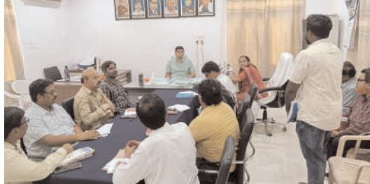
కామారెడ్డి జిల్లా ప్రతినిధి: నీలగిరి వార్డు: