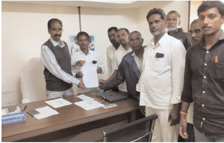
కామారెడ్డి జిల్లా ప్రతినిధి: నీలగిరి వార్త:

బీబీపేట కేంద్రంలో గల అయ్యప్ప వెంచర్ నిర్మాణాలు కొచ్చేరుపులోకి వెళ్లే నీటి కాలువని పూర్తిగా తొలగించి వెంచర్ను విస్తరించి సమీపంలో చిన్న డ్రైనేజీ ఆకారంలో నిర్మించారు. అయితే ఆ యొక్క కాలువ నుండి నిన్ను మొన్నటి తో పాటు ప్రస్తుత భారీ వర్షాలకు కూడా చెరువులోకి చుక్క నీరు రాలేదు. అధికారులు తక్షణమే పాత నీటి కాలువని పునరుద్ధరించాలని ఈ యొక్క సమస్యపై దృష్టి సారించి కొచ్చేరుపు కాలువను గతంలో ఎలా ఉండేదో ఆ విధంగా ఉండేలా చర్యలు తీసుకోవాలని ఆయకట్టు రైతులు బుధవారం నాడు బీబీపేట తహసిల్దార్ కి వినతి పత్రం ఇవ్వడం జరిగింది. దీనితో ఆ ప్రాంత రైతులతో కలిసి ఆందోళన చేపడుతామని స్పష్టం చేసారు.