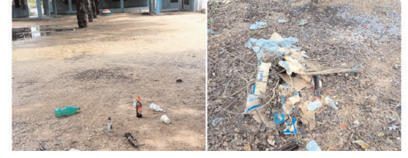
మందిగోండ నీలగిరి ప్రతినిధి సౌజ్ఞంబర4.

మండల పరిధిలోని పెద్దమండల గ్రామంలో బీసీ కాలనీ ప్రాథమిక పాఠశాలలో ఎటువైపు చూసిన మద్యం సీసాలతో కలకలాదుతుంది. పాఠశాలలో చదువుకున్న వారే పాఠశాలలో ఇలాంటి పనులు చేస్తున్నారని పాఠశాల చుట్టూకక్కల ఉన్న ప్రజల సమాచారం. రాత్రి సుమారు 11, 12 గంటల దాకా కూడా మాకు నిద్ర ఉండటం లేదని చుట్టూప్రక్కల ప్రజలు తెలియజేస్తున్నారు. పాఠశాలలో ఇప్పుడు చదువుకునే విద్యార్థులు ఎటువైపు అడుగు వేయాలన్న బయపడుకుంటూ, బిక్కుబిక్కుమంటూ అడుగులో అడుగు వేసుకుంటూ రోజులు గడుపుతున్నారు. ఇప్పటికే దయచేసి ఈ విషయాన్ని పాఠశాల ఉపాధ్యాయులు, గ్రామ పెద్దలు గమనించి ఒకవైపు విద్యార్థులకు, మరో వైపు చుట్టూకక్కల ఉన్న ప్రజలకు ఎలాంటి ఇబ్బందులు లేకుండా చూడాలని, అలాగే పాఠశాలలో చుట్టూకక్కల పనులు చేసే వారిని గమనించి తరలించే చర్యలు తీసుకోవాలని గ్రామ ప్రజలు కోరుకుంటున్నారు.