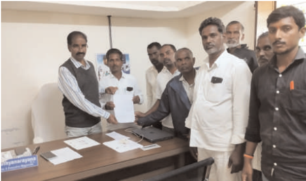
కామారెడ్డి జిల్లా ప్రతినిధి: నీలగిరి వార్త:

బీబీపేట కేంద్రంలో గల అయ్యప్ప వెంచర్ నిర్మాణాలు కొచ్చేరుపు లోకి వెళ్లే నీటి కాలువని పూర్తిగా తొలగించి వెంచర్ను విస్తరించి సమీపంలో చిన్న డ్రైనేజీ ఆకారంలో నిర్మించారు. అయితే ఆ యొక్క కాలువ నుండి నిన్ను మొన్నటి తో పాటు ప్రస్తుత భారీ వర్షాలకు కూడా చెరువులోకి చుక్క నీరు రాలేదు. అధికారులు తక్షణమే పాత నీటి కాలువని పునరుద్ధరించాలని ఈ యొక్క సమస్యపై దృష్టి సారించి కొచ్చేరుపు కాలువను గతంలో ఎలా ఉండేదో ఆ విధంగా ఉండేలా చర్యలు తీసుకోవాలని ఆయకట్టు రైతులు బుధవారం నాడు బీబీపేట తహసిల్దార్ కి వినతి పత్రం ఇవ్వడం జరిగింది. దీనితో ఆ ప్రాంత రైతులతో కలిసి ఆందోళన చేపడుతామని స్పష్టం చేసారు.