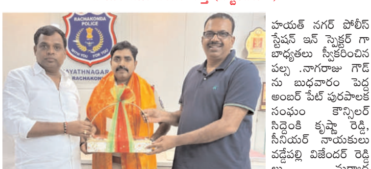
హయత్ నగర్ నీలగిరి వార్త (సెప్టెంబరు 4):

పూర్వకంగా కలిసి సాల్వేషన్ సన్మానించి శుభాకాంక్షలు తెలిపారు.