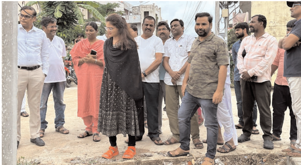
కామారెడ్డి జిల్లా ప్రతినిధి: నీలగిరి వార్త: