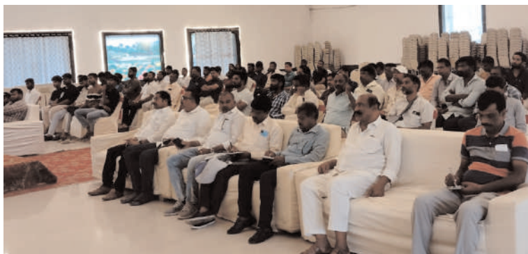
హయత్ నగర్ నీలగిరి వార్త (సెప్టెంబరు 4):