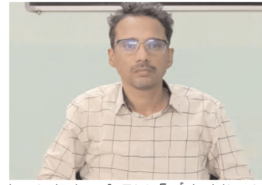
నీలగిరి వార్త వికారాబాద్ జిల్లా ప్రతినిధి

కొత్తగా దరఖాస్తు చేసుకోవటంకు 5-9-2024 నుండి 20-09-2024 ఉదయం 11 గంటల వరకు చేసుకోవచ్చుందిగా ఆయన తెలిపారు. ఇదివరకు జరిగిన విద్యుత్తులో దరఖాస్తు చేసిన వారు మళ్ళీ చేయాల్సిన అవసరం లేదన్నారు.