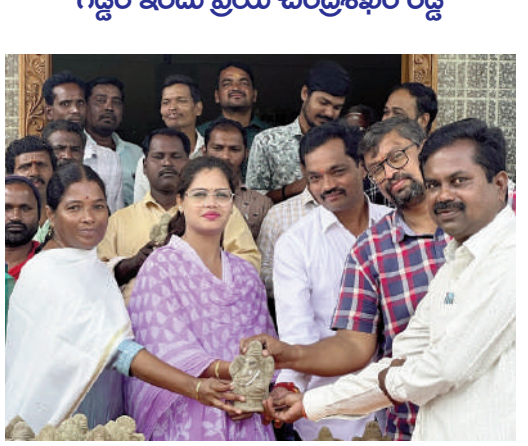
కామారెడ్డి జిల్లా ప్రతినిధి: నీలగిరి వార్త: కామారెడ్డి పట్టణంలోని మున్సిపల్ కార్యాలయంలో శు