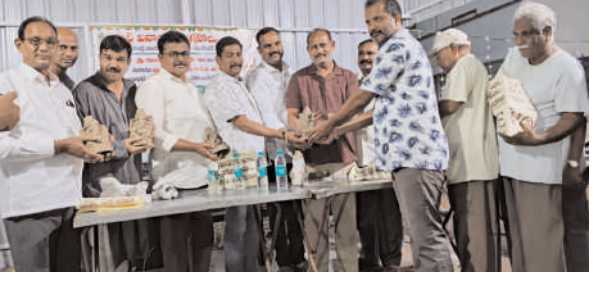
శేరిలింగంపల్లి నీలగిరి వార్త

మాదాపూర్ మండల ప్రాథమిక పాఠశాలలో రీడ్ టు రీడ్ కార్యక్రమంలో భాగంగా ప్రవాస భారతీయ వాసవి సంఘం 25,259 రూపాయలతో పుస్తక మిత్ర ఏర్పాటు చేయడం జరిగింది.