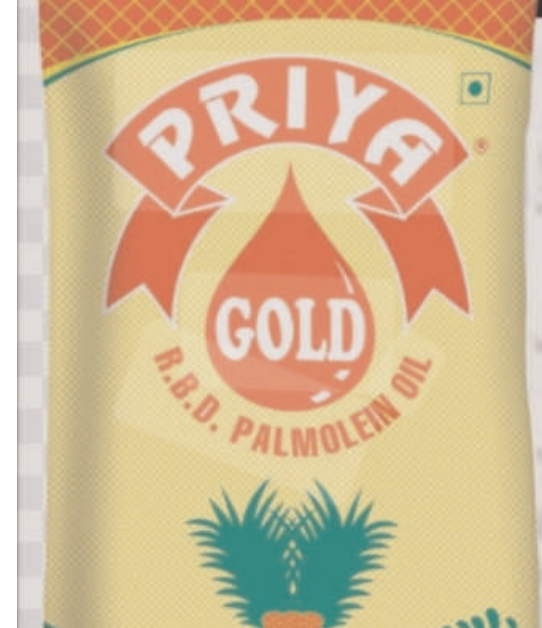
ఉండగా, ఇప్పుడు 160 రూపాయలకు పెరిగింది. ఇప్పుడు సామాన్య, మధ్యతరగతి ప్రజలు వంట నూనెను కొనాలంటే భయపడుతున్నారు.