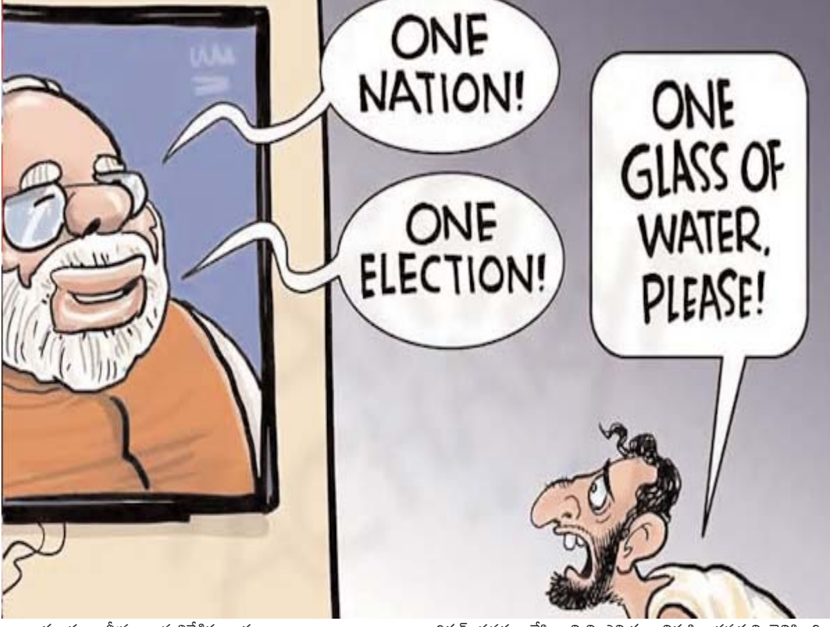
రాజ్యాంగవాదులు తీవ్రంగా వ్యతిరేకిస్తున్నారు. రామ్ నాథ్ కోవింద్ కమిటీ సిఫార్సులు

నరేంద్ర మోడీ ప్రభుత్వం కొన్నేళ్లుగా చెబుతూ వస్తున్న 'ఒకే దేశం-ఒకే ఎన్నిక' ప్రతిపాదనపై మరో అడుగు ముందుకు వేసింది. మాజీ రాష్ట్రపతి రామ్ నాథ్ కోవింద్ సారథ్యంలోని కమిటీ ఈ ప్రతిపాదనపై ఇచ్చిన నివేదికను కేంద్ర మంత్రివర్గం లాంఛనంగా ఆమోదించడంతో దేశవ్యాప్త చర్చ ప్రారంభమైంది. 2014లో తొలిసారి అధికారంలోకి వచ్చిన తర్వాత గత దశాబ్ద కాలంలో నరేంద్ర మోడీ ప్రభుత్వం భారత ప్రజల భిన్నత్వ బహుళత్వ సంస్కృతిపై దాడి ప్రారంభించింది. దేశంలో ఒకే మతం వుండాలని, ఒకే రకమైన పన్ను వుండాలని, ఒకే రకమైన తిండి తినాలని, ఒకే రకమైన సంస్కృతి, భాష ఉండాలని చేస్తున్న దాడులలో భాగంగా ఇప్పుడు 'ఒకే ఎన్నికలు' ఉండాలని కేంద్ర కేబినెట్ ఆమోదించింది. 2022 డిసెంబర్లో జాతీయ లా కమిషన్ ఓ ధర్మ సందేశాన్ని వెలుబిచ్చింది. జమిలి ఎన్నికలు ప్రజాస్వామ్యానికి, రాజ్యాంగ మౌలిక నిర్మాణానికి, సమాఖ్య రాజ్యపాలనా పద్ధతికి భంగకరం కావచ్చని పేర్కొన్నది. దీనికి రామ్ నాథ్ కోవింద్ కమిటీ ఎటువంటి సమాధానం చెప్పలేదు. జమిలి ఎన్నికలు జరపాలని కేంద్ర కేబినెట్ ఆమోదించటాన్ని ముఖ్యమైన రాజకీయ పార్టీలు, ప్రజాస్వామ్యవాదులు, లౌకికవాదులు,