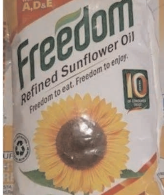
రూపాయలకు చేరుకుంది. సన్ ఫ్లవర్ ఆయిల్ గతంలో ప్యాకెట్ 120 రూపాయలు ఉండగా, ప్రస్తుతం 150 రూపాయలు పెరిగింది. వేరుశనగ నూనె గతములో 110 రూపాయలు

పెద్ద దోర్నాల నీలగిరి వార్త సెప్టెంబర్ 21. పెద్ద దోర్నాల మండలంలో వంట నూనె ధరలు చుక్కలు అంటున్నవి. ఈ ధరలకు మధ్యతరగతి సామాన్య మహిళలు ప్రజలు విలవిలాడిపోతున్నారు. వంట నూనె కొనలేక, పిండి వంటలు చేసుకోవాలంటే, నూనె కొనక తప్పదు. అయితే ఇప్పుడు నూనె ధరలు అధికంగా పెరగడంతో నూనె కొనలేక, పిండి వంటలు చేసుకోలేక మహిళలు అనేక ఇబ్బందులు పడుతున్నారు. వంట నూనె లేకుండా ఆహార పదార్థాలు తయారు చేయడం కష్టతరమే. రుచికి సలసల కాగే నూనె వంటతో పాటు ఉండాలిందే. రిఫైన్డ్ వంటి నూనెల పై గతంలో ఎలాంటి పన్ను లేదు. ఇప్పుడు కేంద్ర ప్రభుత్వం ఒక్కసారిగా నూనెపై దిగుమతి సుంకాన్ని పెంచడంతో గతంలో కొన్ని రోజులుగా నిలకడగా ఉన్న ధరలు, ఈనెల 13వ తేదీ నుండి ఒక్కసారిగా లీటర్ 20 రూపాయలు నుండి 30 రూపాయలు వరకు పెరిగాయి. ఈ ప్రభావముతో ఎక్కువగా సామాన్య, మధ్యతరగతి ప్రజలు ఉపయోగించే పామాయిల్, సన్ ఫ్లవర్ ఆయిల్, ధరలు మంటల ముందుకు వచ్చాయి. దీంతో సామాన్య జిల్లా గాడి తప్పింది. పామాయిల్ లీటర్ ప్యాకెట్ ధర గతములో 95 రూపాయలు ఉండగా, ఇప్పుడు 120