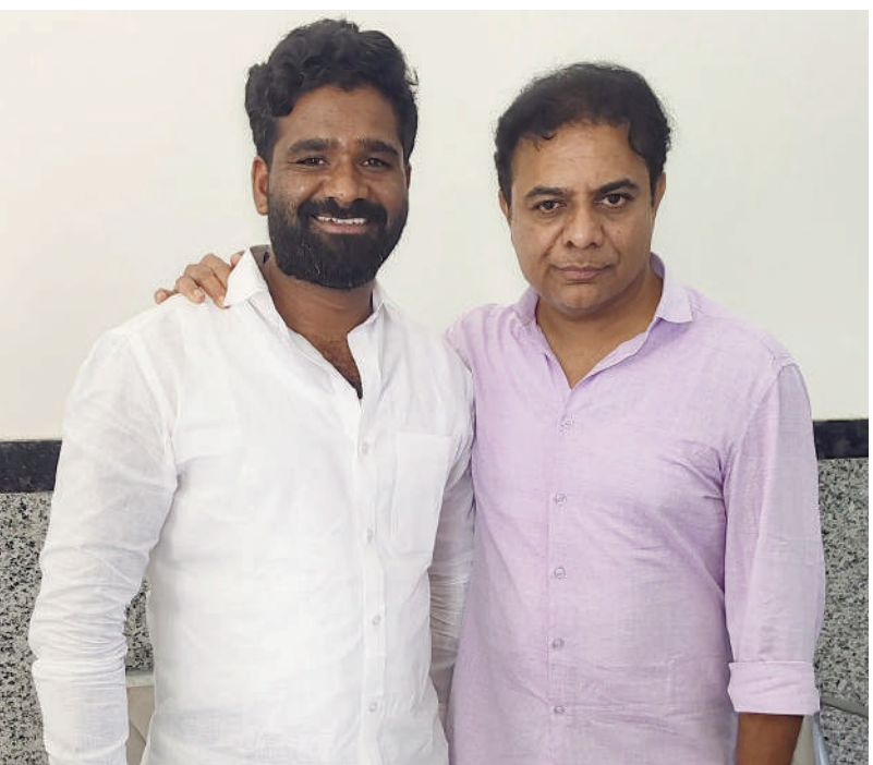
శేరిలింగంపల్లి నీలగిరి వార్త రంగారెడ్డి జిల్లా బ్యూరో