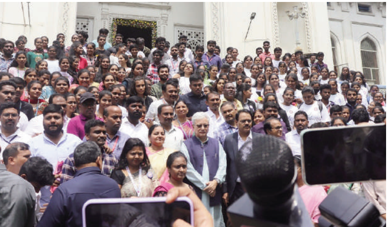
శేరిలింగంపల్లి నీలగిరి వార్త