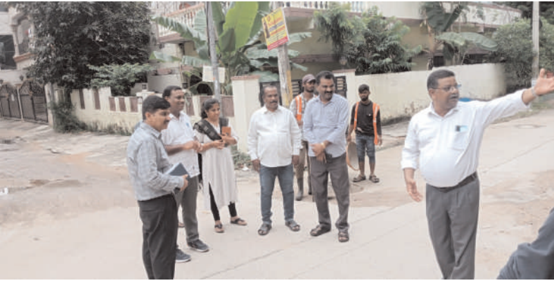
మల్కాజ్గిరి నీలగిరి వార్త ప్రతినిధి

డ్రైనేజీ సమస్యను పరిశీలించిన వారల్ వర్క్, మున్సిపల్ అధికారులు