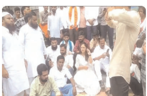
కామారెడ్డి జిల్లా ప్రతినిధి: నీలగిరి వార్త: