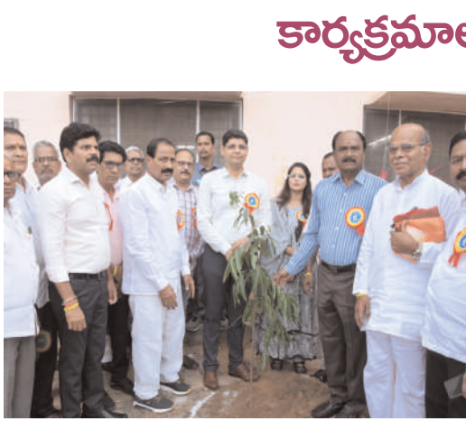
జిల్లా కలెక్టర్ ఆశీష్ సాంగ్వాన్