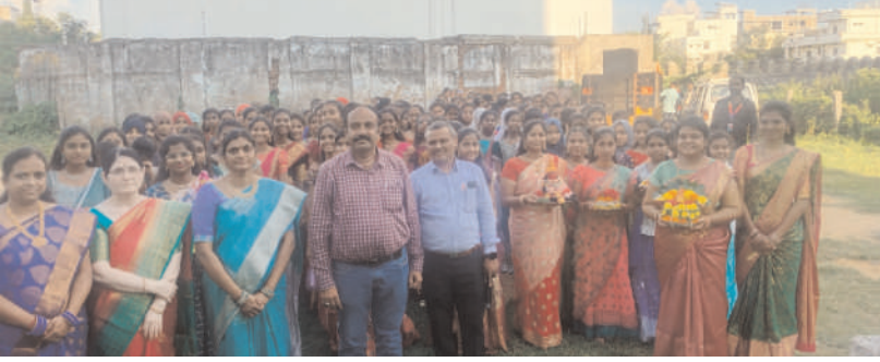
కామారెడ్డి జిల్లా ప్రతినది: నీలగిరి వార్త: