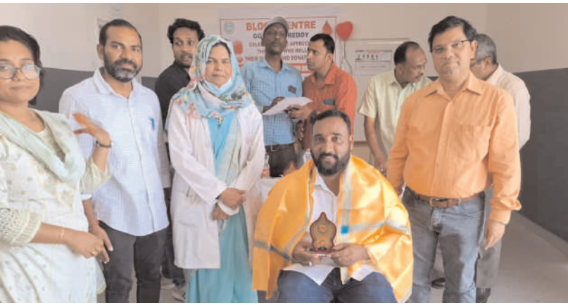
కామారెడ్డి జిల్లా ప్రతినది: నీలగిరి వార్త: