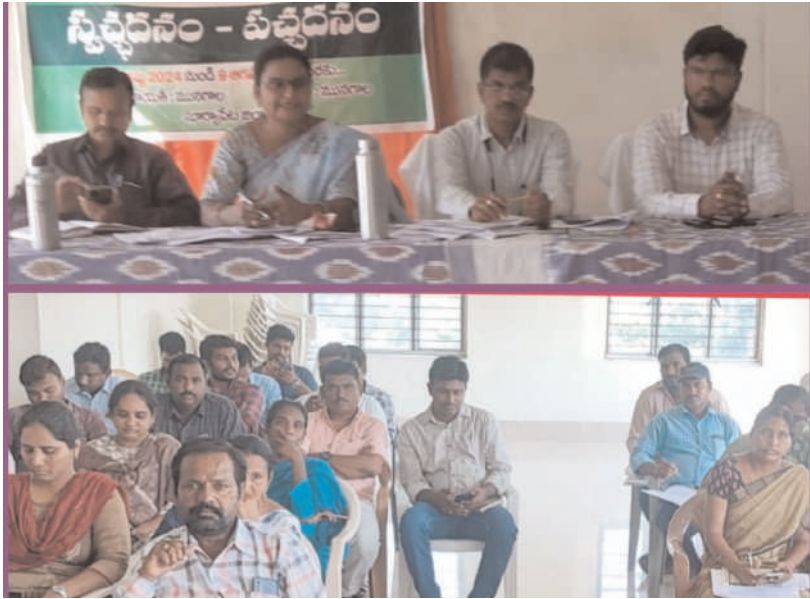
మునగాల ప్రతినిధి నీలగిరివార్త: అక్టోబర్ 01

గ్రామసభలు నిర్వహణ ఉపాధి హామీపనులగుర్తింపు ఎంపీడివో రమేష్ దీన్ దయాల్