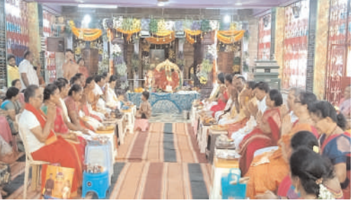
దేవరకొండ నీలగిరి వార్త

దేవరకొండ పట్టణంలోని శ్రీ వాసవి కన్యకా పరమేశ్వరి దేవాలయంలో శరన్నవరాత్తులలో భాగంగా గురువారం దేవాలయంలో తెల్లవారజామున మూలవిరాట్టులకు అభిషేకం ధ్వజారోహణ బలి హరణ లక్ష్మీ గణపతి హోమం