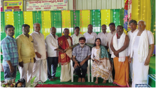
దేవరకొండ నీలగిరి వార్త

దేవి శరన్నవరాత్తులో భాగంగా కొండమల్లేపల్లిలోని సాగర్ రోడ్ లో గల శ్రీ కన్యకా పరమేశ్వరి దేవాలయంలో దుర్గామాతను ప్రతిష్ఠించి ఉత్సవ విగ్రహాలకు అభిషేకాలు అర్చనలు నిర్వహించారు ఈ సందర్భంగా దంపతులు పూజలో పాల్గొనగా వేద పండితులచే మంత్రోచ్ఛారణ అభిషేకాలు అర్చనలు నిర్వహించారు. ఈ సందర్భంగా పట్టణ ఆర్థికవైశ్య