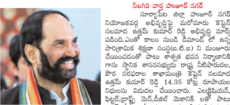
నీలగిరి వార్త హజూర్ నగర్

భవన నిర్మాణానికి 14.35 కోట్ల నిధులు విడుదల ఐదు కోర్టులలో 216 మందికి అవకాశం ప్రిన్సిపాల్ తో సహా 8 పోస్టుల మంజూరి నియోజకవర్గంపై మరోమారు కెప్టెన్ అభిషేఖ్ మార్