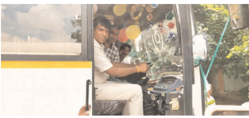
ఎమ్మిగనూరు సీలగిరి వార్డు (08 అక్టోబర్)