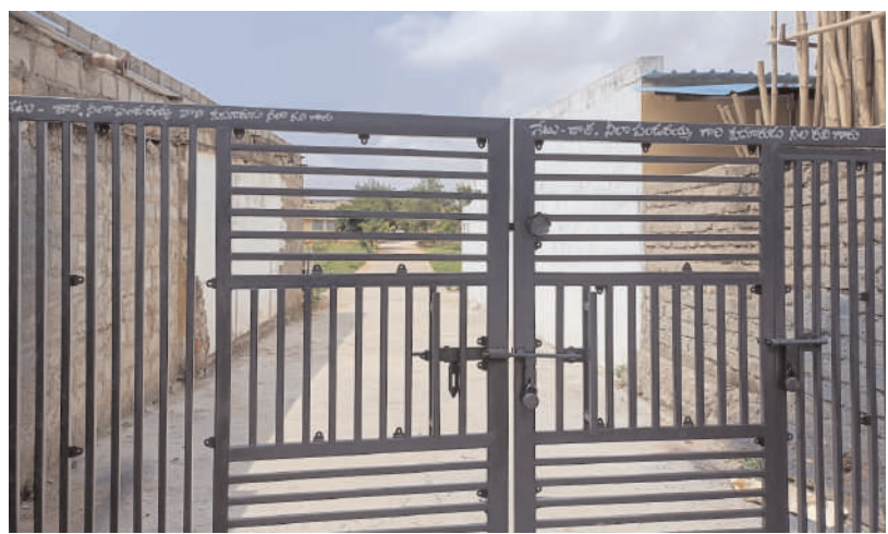
దేవరకొండ నీలగిరి వార్త