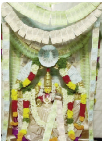
పెద్ద దోర్నాల సీలగిరి వార్డు అక్టోబర్ 8.