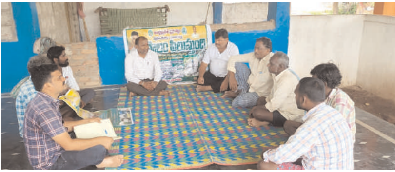
పెద్ద దోర్నాల సీలగిరి వార్డు అక్టోబర్ 8.