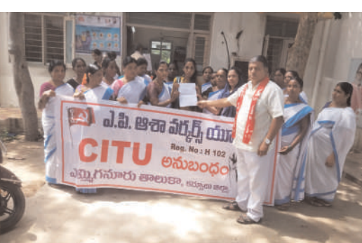
నందవరం సీలగిరి వార్డు (08 అక్టోబర్)