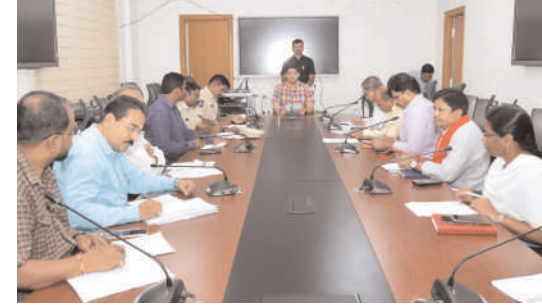
కామారెడ్డి జిల్లా ప్రతినిధి: సీలగిరి వార్డు: