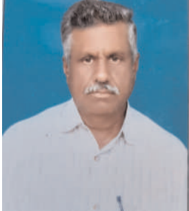
నందవరం సీలగిరి వార్డు (08అక్టోబర్)