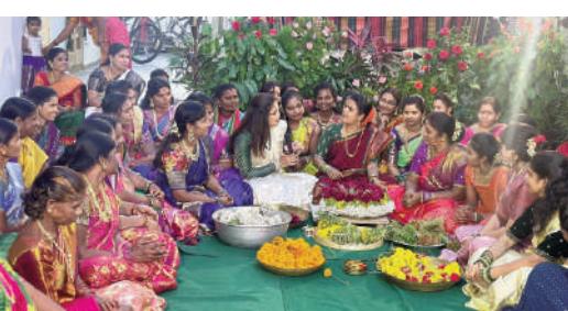
కామారెడ్డి జిల్లా ప్రతినిధి: సీలగిరి వార్డు:

కామారెడ్డి పట్టణంలో మంగళవారం బతుకమ్మ పండుగ సం