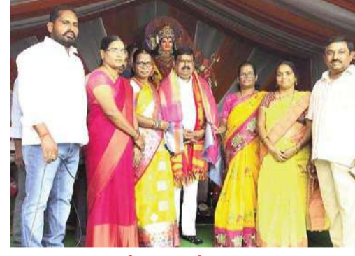
దేవరకొండ నీలగిరి వార్త

అంగరంగ వైభవంగా దుర్గామాత శోభయాత్ర హాజరైన దేవరకొండ ఎమ్మెల్యే ఘనంగా సన్మానించిన కమిటీ నిర్వాహకులు