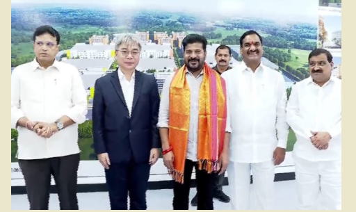
కొంగరకలాన్ ఫ్యాక్టరీ కంపెనీని ముఖ్యమంత్రి రేవంత్ రెడ్డి, మంత్రి శ్రీధర్ బాబు సందర్శించారు. ఫ్యాక్టరీ కంపెనీ ప్రతినిధులతో సమావేశం నిర్వహించారు. కంపెనీ పురోగతి, ఇతర అంశాలను అడిగి తెలుసుకున్నారు.

పవీ & తెలంగాణ | ఎడిటర్ : గుంటోజు విష్ణుమూర్తి | మంగళవారం | 15-10-2024 | సంపుటి : 15 | సంచిక : 106 | పేజీలు : 12 | వెల : 5/-