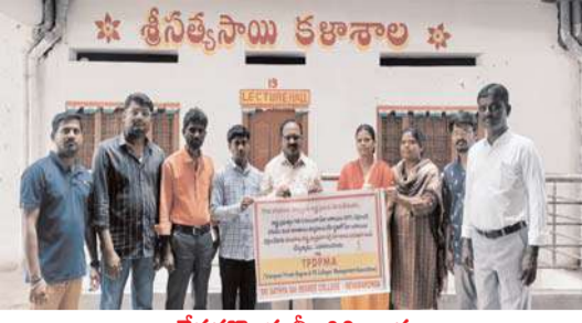
దేవరకొండ నీలగిరి వార్త

ప్రైవేట్ డిగ్రీ కళాశాలల ఫీజు రియంబర్స్ వెంటనే చెల్లించాలి ఉద్యోగస్తులకు జీతాలు ఇవ్వలేకపోతున్నాం కళాశాలలను నడిపే పరిస్థితి లేదు అప్పులు పెరిగిపోతున్నాయి 50 వేల అధ్యాపకుల కుటుంబాలు ఉపాధి కోల్పోనున్నాయి ప్రైవేటు డిగ్రీ కళాశాలల యజమాన్యాల బాధలు ప్రభుత్వం పట్టించుకోవాలి విద్యాశాఖ ముఖ్యమంత్రి పేపీలో ఉంది ముఖ్యమంత్రి రేవంత్ రెడ్డి నిర్ణయం తీసుకోవాలి కళాశాలలను బతికించండి అధ్యాపకుల ఉపాధి కల్పించండి