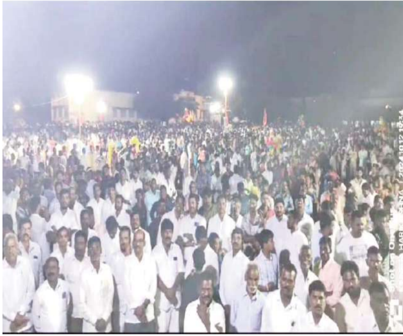
దేవరకొండ నీలగిరి వార్త