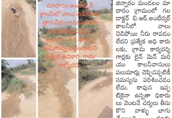
నేలగిరి దినపత్రిక జిన్నారం

జిన్నారం మండలం మాదారం గ్రామంలో గల డాక్టర్ బి.ఆర్.అంబేద్కర్ కాలనీలో వాలు పెడిపోయి నీరు రావడం లేదని ప్రత్యేక అధి కారు లకు, గ్రామ కార్యదర్శి గార్తకు లైన్ మెన్ మరియు కాలనీవాసులు పలుమార్లు చెప్పినప్పటికీ సమస్యను పరిశోధించడం లేదు. కావున ఇప్పటికైనా ఉన్నతాధికారులు వెంటనే చర్యలు తీసుకొని వాళ్ళు మాకు చేయించి మాకు