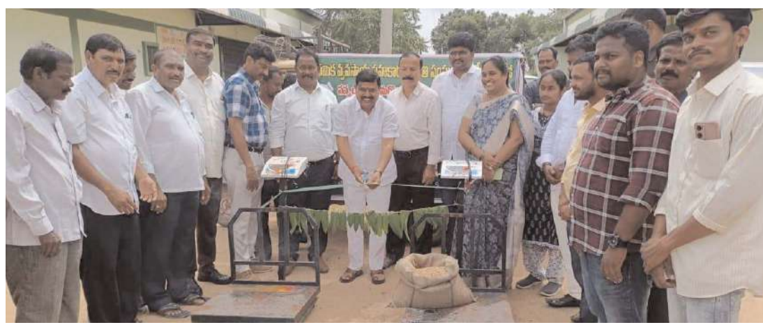
దేవరకొండ నీలగిరి వార్త