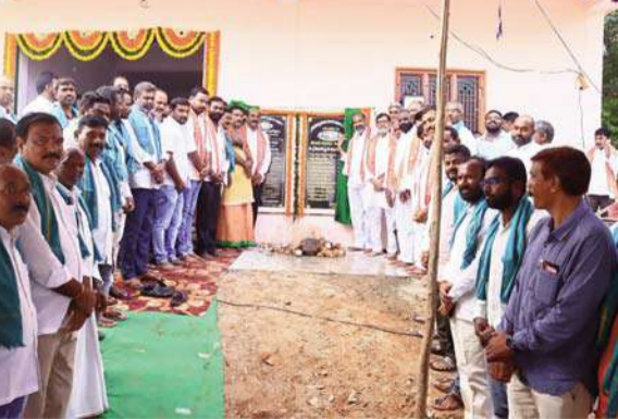
నీలగిరి వార్త వేములవాడ ప్రతినిధి

రాజన్న సిరిసిల్ల జిల్లా వేములవాడ అర్బన్ మండలం రుద్రవరం గ్రామంలో వ్యవసాయ సహకార సంఘం నూతన భవనాన్ని ప్రభుత్వ విప్ ఎమ్మెల్యే ఆది శ్రీనివాస్ టెన్సాజ్ చైర్మన్ కొండుల రవీందర్ రావు రుద్రవరం ప్రాథమిక సహకార సంఘం చైర్మన్ రావు తో కలిసి ప్రారంభించారు. రైతులను రాజాగా చేయడం కోసం సహకార సంఘాలను బలోపేతం చేస్తున్నామని అన్నారు. రైతులను సహకార బ్యాంకులను సద్వినియోగం చేసుకోవాలని కోరారు. ఈ కార్యక్రమంలో సహకార సంఘం పాలకవర్గం అధికారులు ప్రజా ప్రతినిధులు ప్రజలు పాల్గొన్నారు.