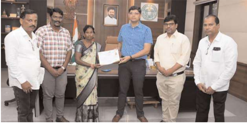
కామారెడ్డి జిల్లా ప్రతినిధి: నీలగిరి వార్త: