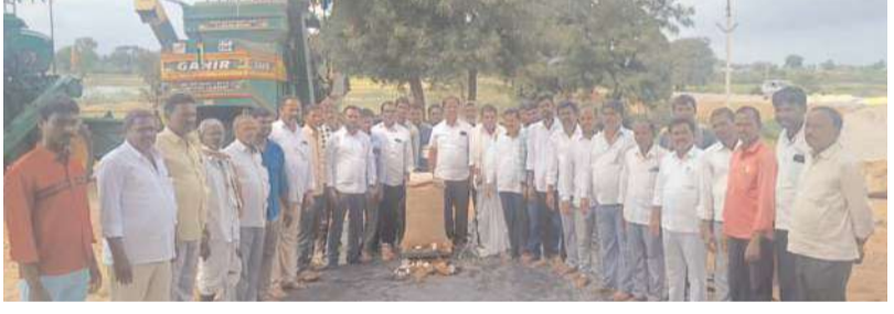
నీలగిరి వార్త నాగిరెడ్డిపేట: