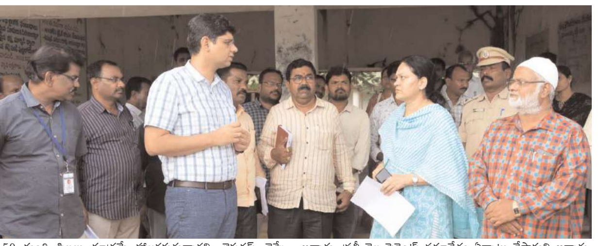
150 మంది పిల్లలు మాత్రమే హాజరువుతున్నారని, లెక్చర్స్ చెప్పే అన్నారు. ప్రతి నెల పెరెంట్స్ సమావేశం ఏర్పాటు చేస్తామని అన్నారు. లెక్చర్స్ కు తప్పని సరిగా హాజరు అయి, ఉత్తీర్ణత శాతం పెంచాలని పిల్లలు రెగ్యులర్ గా కళాశాలకు వచ్చినప్పటికీ మధ్యాహ్నం భోజన