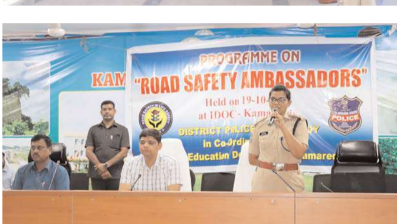
కామారెడ్డి జిల్లా ప్రతినిధి: నీలగిరి వార్త :