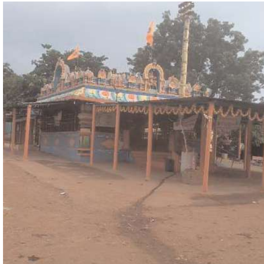
కుటుంబం నిర్మించినంత మాత్రాన తాతలు, తండ్రులు, పిల్లలు, వారి పిల్లలు గుడి చైర్మన్లు గా కొనసాగాలని రూల్స్ ఏవైనా ఉన్నాయో అనే ప్రశ్నలు దిగుతున్నాయి. దండెత్తుతున్న గిరిజన సంఘాలు ఇంకెన్నాళ్లు ఈ దొర వారి దోపిడీ అని గిరిజన సంఘ

ఆలనా పాలన లేని కోట మైసమ్మ అమ్మవారి దేవాలయం నిర్వహణలో పంపిణీగా మారింది అనే ఆరోపణలు ఉన్నాయి. దీనికి సంబంధించి రాష్ట్ర ముఖ్యమంత్రి మరియు రాష్ట్ర దేవాలయ శాఖ మంత్రి ప్రత్యేకంగా ధృష్టి పెట్టాల్సిన చారిత్రకమైన అవసరం ఎంతైనా ఉంది అనడంలో సందేహం లేదు. భక్తుల సౌకర్యాలతో పాటు ఆలయం వద్ద వచ్చే ఆదాయ వ్యయాలకు సంబంధించి కూడా అనేక విమర్శలు తలెత్తుతున్నాయి. దీని సంబంధించి అనేక అంశాలు రోజురోజుకు వెలుగులోకి వస్తుండడం గమనార్హం. వాస్తవానికి ఈ ఆలయ నిర్వహణకు సంబంధించి పరిశీలించిన పక్షంలో డోలతనం బయటపడుతోంది. కోట మైసమ్మ అమ్మ వారి దేవాలయం పట్టణి వారి తాతలు స్థానిక గిరిజనులు కష్ట పడితే పర్వ