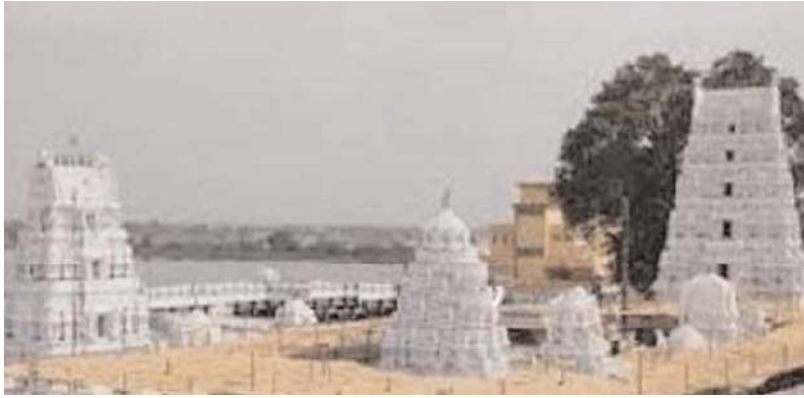
నీలగిరి వార్త వేములవాడ ప్రతినిధి

రాజస్థాన్ సీరిస్ బిల్డింగ్ జిల్లా అభివృద్ధి కోసం పరిధి పెంచినట్లు ఉత్తరప్రదేశ్ పేరొస్తున్న ప్రభుత్వం వేములవాడ టెంపుల్ ఏరియా డెవలప్ మెంట్ అథారిటీ వీటిడివీ పరిధి పెంచుతూ ప్రభుత్వం ఉత్తరప్రదేశ్ జారీ చేసింది. గతంలో వేములవాడతో పాటు వేములవాడ అర్బన్ మండలం వీటిడివీ పరిధిలో ఉంది ప్రస్తుతం రాష్ట్ర ప్రభుత్వం రాజస్థాన్ సీరిస్ బిల్డింగ్ జిల్లాలోని సీరిస్ బిల్డింగ్ మున్సిపాలిటీతో పాటు బోయినపల్లి ఇల్లంతకుంట్ల ఎల్లారెడ్డిపేటవీరప్పల్లి ముస్తాబాద్ గంభీరావుపేట చంద్రుర్రుర్రంగి వేములవాడ రూరల్ కోనరావుపేట మండలాల్లోని 152 రెవెన్యూ గ్రామాలను వీటిడివీ పరిధిలోకి తీసుకొస్తూ ప్రభుత్వం జీవో జారీ చేసింది ఇకనుండి ఆయా మండలాల్లోని గ్రామాలను వీటిడివీ పరిధిలోకి త్వరలో రానున్నాయి.