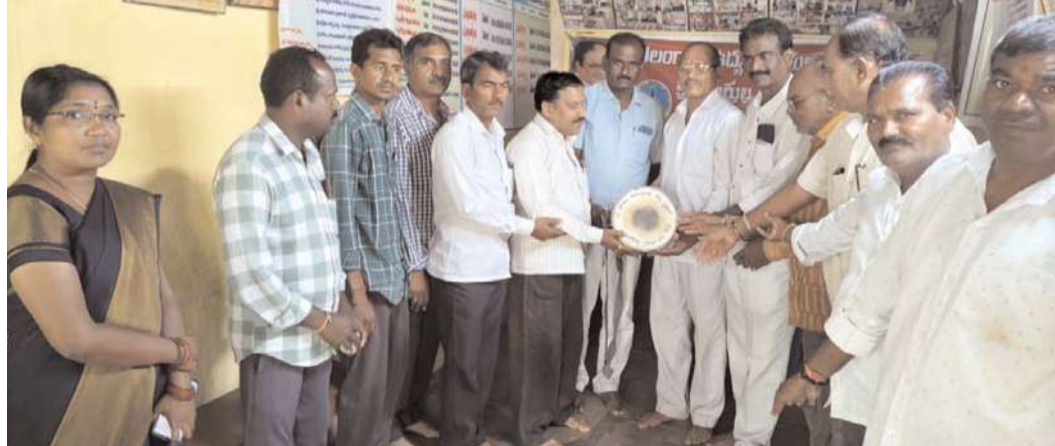
నీలగిరి వార్త వేములవాడ ప్రతినిధి