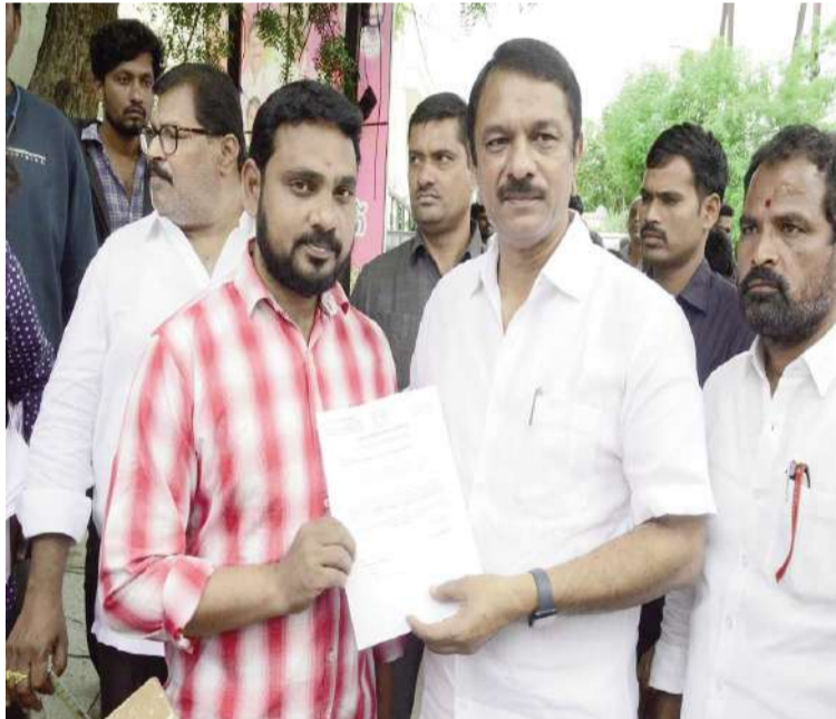
హయత్ నగర్ సీలగిరి వార్త (అక్టోబర్ 27) :

బాధిత భర్త నాగరాజు కి 2,50,000 రూపాయల ఎల్.ఓ.సి.ఆంధ్రజ్యోతి ఎల్.బి.నగర్ ఎమ్మెల్యే దేవిరెడ్డి సుదీర్ రెడ్డి