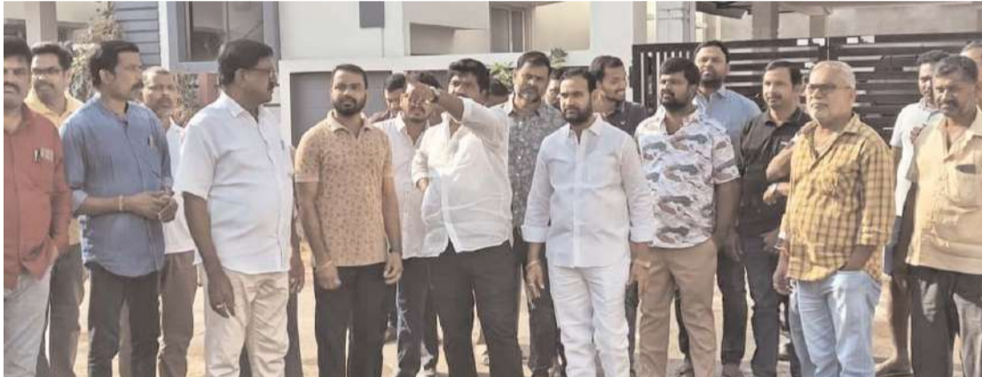
కార్యాలయ కలెక్టర్ నవజీవన్ రెడ్డి హయత్ నగర్ సీలగిరి వార్త (:అక్టోబర్ 27)

హయత్ నగర్ డివిజన్ కార్యాలయ కలెక్టర్ నవజీవన్ రెడ్డి ఆదివారం కాలనీవాసుల విజ్ఞప్తి మేరకు డివిజన్లోని లక్ష్మీ త్రియ కాలనీలో కాలనీవాసులతో కలిసి పర్యటించి కాలనీలోని పలు సమస్యలను తెలుసుకోవడం జరిగింది. ఈ సందర్భంగా కాలనీ వాసులు కాలనీలో మౌలిక వసతుల కొరత ఉండడంతో కాలనీవాసులు అవస్థలు పడుతున్నారని కార్యాలయ కి కాలనీవాసులు వివరించారు. ముఖ్యంగా కాలనీ లోని పలు వీధుల్లో భూగర్భ డ్రైనేజీ, మంచి నిల్వీ పైప్ లైన్ సదుపాయం లేకపోవడంతో కాలనీవాసులు ఇబ్బందులు ఎదుర్కొంటున్నారని, అదేవిధంగా భూగర్భ డ్రైనేజీ పైప్ లైన్ మరియు మంచి నిల్వీ పైప్ లైన్ నిర్మాణం పూర్తయిన బోట సీసీ రోడ్ల నిర్మాణం చేపట్టాలని కాలనీవాసులు కార్యాలయ కి తెలిపడం జరిగింది. స్పందించిన కార్యాలయ సంబంధిత అధికారులతో సమీక్షించి