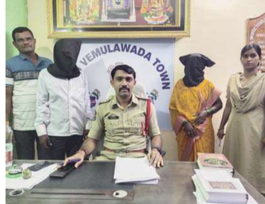
వారి మధ్యలో లేబర్లకు సంబంధించి దబ్బులు విషయంలో