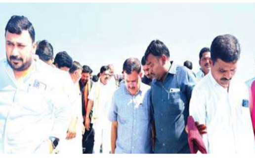
దేవరకొండ సీలగిరి వార్డు

కొండమల్లెపల్లి మండల పరిధిలోని పెండ్లిపాకల గ్రామం వద్ద ఏర్పాటు చేసిన వరి ధాన్యం కొనుగోలు కేంద్రాన్ని ఆకస్మికంగా తనిఖీ చేసి, వరి ధాన్యం సేకరణ రికార్డును పరిశీలించి చి.రైతులకు గిట్టుబాటు ధర కల్పించాలని అధికారులను దేవరకొండ ఎమ్మెల్యే నేనావత్ బాలు నాయక్ ఆదేశించారు. గురువారం కొండమల్లెపల్లి మండలంలో ధాన్యం కొనుగోలు కేంద్రాల్లో ఆక్రమాలకు పాలిడిన్ వారిపై కఠిన చర్యలు తీసుకుంటామని హెచ్చరించారు. కొనుగోలు కేంద్రాల్లో ఇబ్బందులు ఉంటే