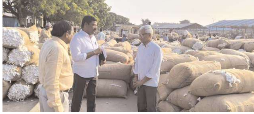
ఖమ్మం, సీలగిరి వార్డు ప్రతినిధి నవంబర్ 7.

గురువారం వ్యవసాయ మార్కెట్ కమిటీ పరిధిలోని పత్తి మార్కెట్ యార్డ్ నందు క్రయ విక్రయాలను అదనపు కలెక్టర్ పి. శ్రీనివాసరెడ్డి తనిఖీ చేశారు. పత్తి అమ్మకం నిమిత్తం రైతులు మార్కెట్ యార్డ్ కు తీసుకుని వచ్చిన పత్తి బస్తాల తేమ శాతం నిర్ధారించే మాయిశ్చర్ మీటర్లు ద్వారా తేమను పరిశీలించి, ధరల వ్యత్యాసాలను పరిశీలించి రైతులకు అధిక ధర పొందుటకు తీసుకోవలసిన జాగ్రత్తలపై అదనపు కలెక్టర్ అవగాహన కల్పించారు. మార్కెట్ యార్డ్ లో ఉన్న సౌకర్యాలను తెలుసుకుని మార్కెట్ యార్డ్ కార్యకలాపాలను సజావుగా నిర్వహించేందుకు అన్ని రకాల జాగ్రత్తలు చేపట్టాలని మార్కెట్ కార్యదర్శి, సిబ్బందిని ఆదేశించారు.