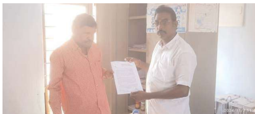
పెద్ద దోర్నాల సీలగిరి వార్డు నవంబర్ 7.