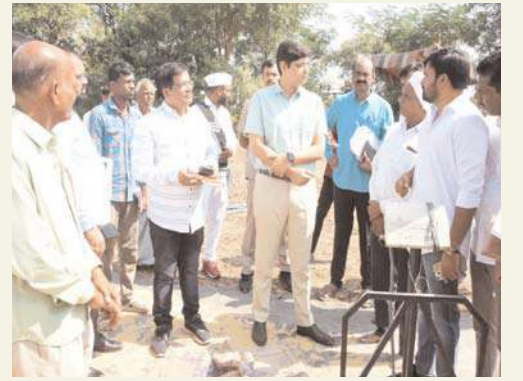
కొనుగోలు ధాన్యాన్ని మిల్లులకు తరలించాలి