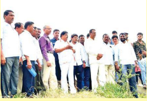
రైతులకు సాగునీరు అందించడమే లక్ష్యం