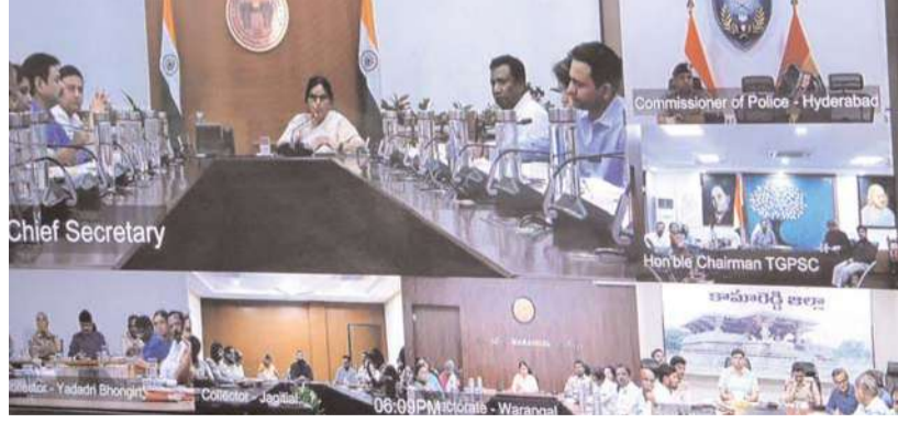
కామారెడ్డి జిల్లా ప్రతినిధి: నీలగిరి వార్త: