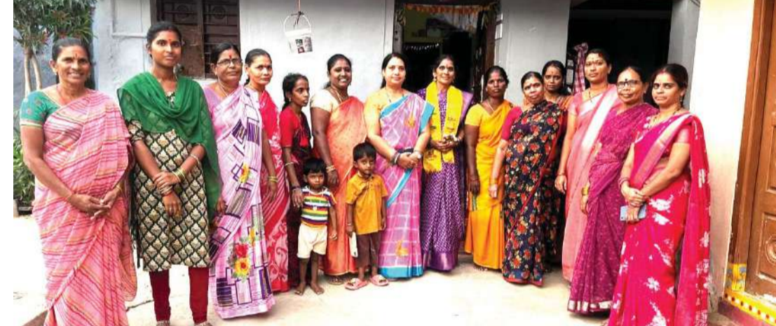
దేవరకొండ సీలగిరి వార్త బడుగు బలహీన వర్గాల ఆశాజ్యోతి పేదల పెన్సిన్లు తెలంగాణ