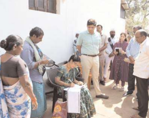
జిల్లా కలెక్టర్ ఆశిష్ సాంగ్వాన్