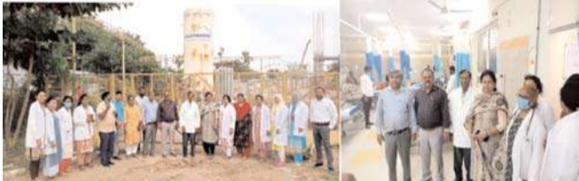
సీలగిరి వార్త, సూర్యాపేట టౌన్:-