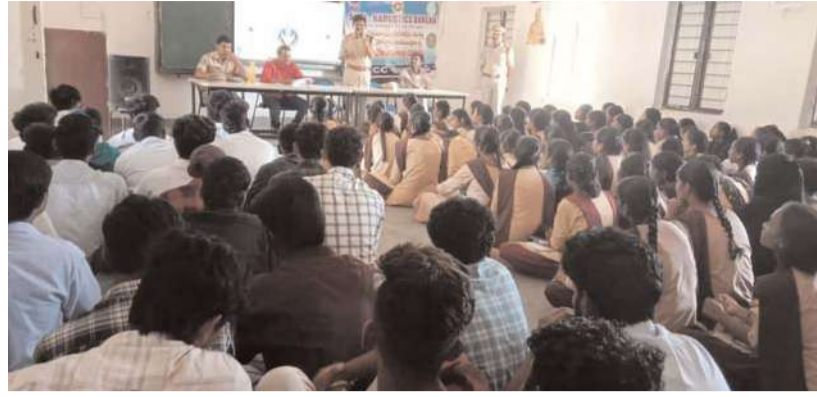
కామారెడ్డి జిల్లా ప్రతినిధి: నీలగిరి వార్త:

మోడల్ స్కూల్ సదాశివనగర్ లో ప్రోగ్రాం నిర్వహించినది. కార్యక్రమంలో నార్కోటిక్స్ విభాగం, కళ్యాణం, షీటీం, సైబర్ క్రైమ్, ఏహెచ్ టీయూ గురించి అవగాహన కల్పించినది.