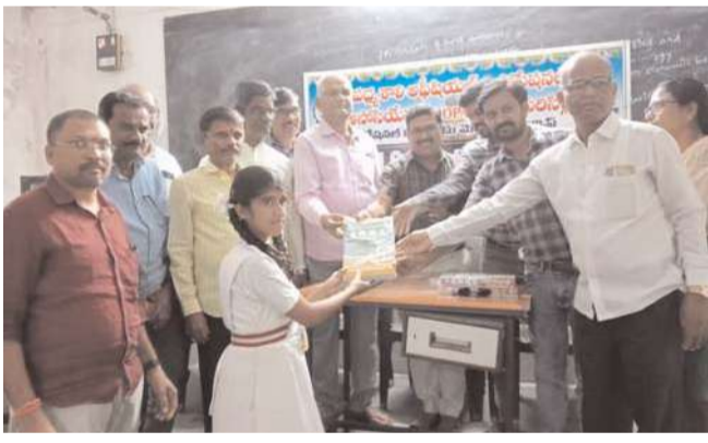
సీలగిరి వార్త వేములవాడ ప్రతినిధి

పద్మశాలి అఫీషియల్స్ అండ్ ప్రొఫెషనల్స్ అసోసియేషన్ స్కాలర్ షిప్