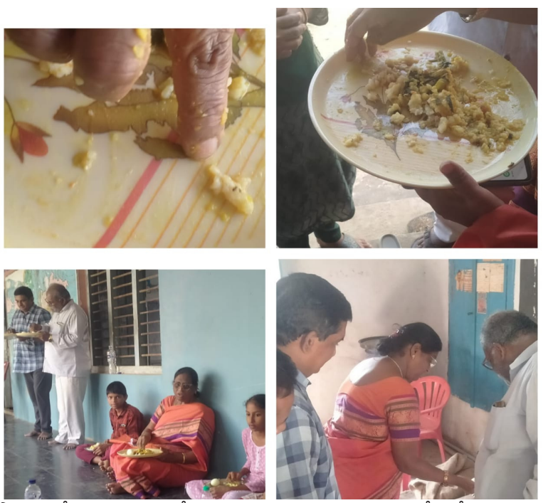
పాఠశాలలో నిత్యం జరుగుతున్న ఉన్నాయి. ఈ సంఘటనకు బాధ్యులైన ఎంఈఓ, పాఠశాల హెచ్ఎం, వంట సిబ్బంది పై చర్యలు తీసుకోవాలని పలువురు విద్యార్థుల తల్లిదండ్రులు డిమాండ్ చేస్తున్నారు.

చేస్తున్నారు. జిల్లా అధికారులు కూడా ఆ భోజనాన్ని రుచి చూశారు. అధికారుల భోజనంలో పురుగులు దర్శనం ఇచ్చాయి. దీంతో అధికారులు ఒకసారిగా అవాక్కయ్యారు. అధికారులు విద్యార్థులతో మాట్లాడగా వారు విస్తుపోయే నిజాలు అధికారులకు చెప్పారు. ప్రతిరోజు భోజనంలో పురుగులు వస్తూ ఉన్నాయని పురుగులను ఏరుకోని అన్నం తింటున్నామని చెప్పారు. అధికారులు ఆశ్చర్యపోయారు. అదే సమయంలో పాఠశాల హెచ్ఎం, డీవర్ల ను వంట వండే వారిని తీవ్రంగా హెచ్చరించారు. మీ ఇళ్లలో కూడా ఇలాగే వంట చేసి మీరు తినే మీ పిల్లలు పెడతారా అని జిల్లా పంచాయతీ అధికారి వారిని ప్రశ్నించారు. దీంతో వారు చేసేది ఏమీ లేక నీళ్లు సమీకరించారు. దీనిపై జిల్లా కలెక్టర్ కు ఫిర్యాదు చేస్తానని డిపిఓ హెచ్చరించారు. ఏది ఏమైనా మండల విద్యాశాఖ అధికారి పాఠశాలల హెచ్ఎంల వర్యవేక్షణ లేకపోవడం వల్ల ఇలాంటి సంఘటనలు మండలం లో ఏదో ఒక