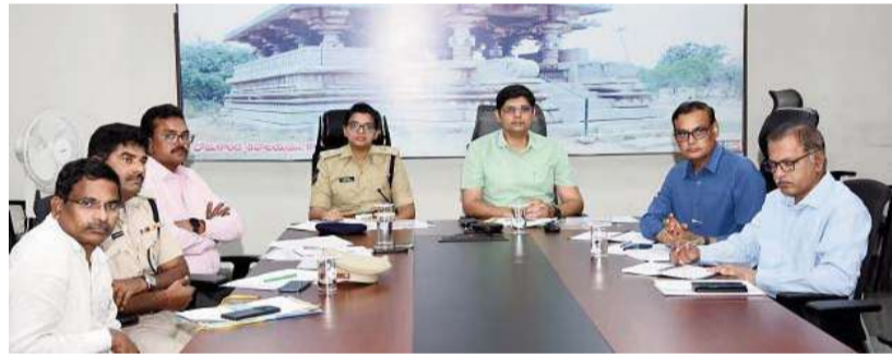
కామారెడ్డి జిల్లా ప్రతినిధి: నీలగిరి వార్త:

నవంబర్ 17, 18 తేదీల్లో చేపట్టే తెలంగాణ పబ్లిక్ సర్వీస్ కమిషన్ గ్రూమ్-3 పరీక్షలకు పకడ్బందీగా ఏర్పాట్లు చేయాలని, పరీక్షల నిర్వహణ విజయవంతం చేయాలని తెలంగాణ పబ్లిక్ సర్వీస్ కమిషన్ ఛైర్మన్ ఎం. మహేందర్ రెడ్డి తెలిపారు.