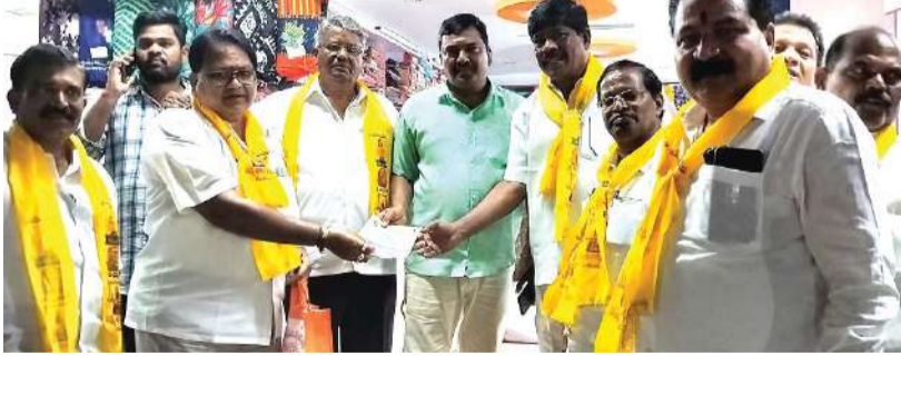
దేవరకొండ సీలగిరి వార్త

ఈనెల 16న శనివారం కొండ లక్ష్మణ్ బాపూజీ విగ్రహావిష్కరణ