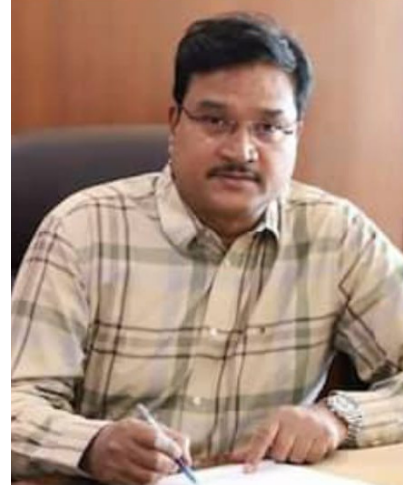
రంగనాథ్ తెలిపారు. చెరువులను పునరుద్ధరించాలంటే ఇళ్లను కూల్చాల్సిన అవసరం లేదన్నారు. చెరువులో నీటి