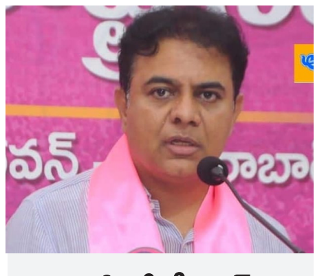
అదానీతో రేవంత్ ఒప్పందాలు రద్దు చేయాలి