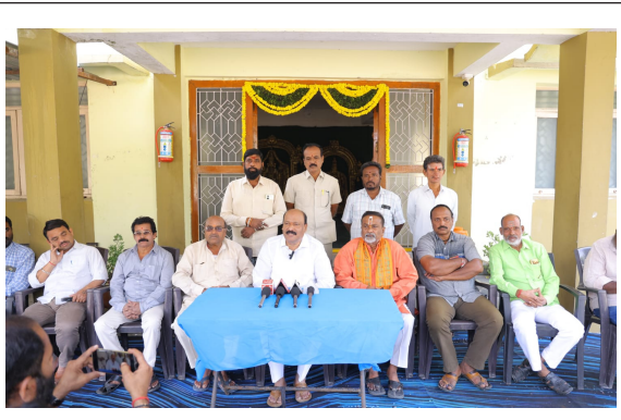
మన సంస్కృతిని కాపాడుకుందాం