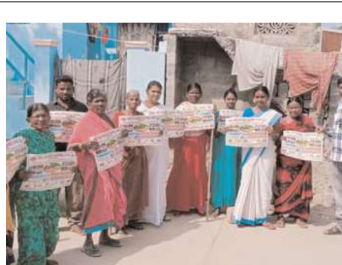
చిలకడోన్ గ్రామంలో తాగునీటి సమస్య