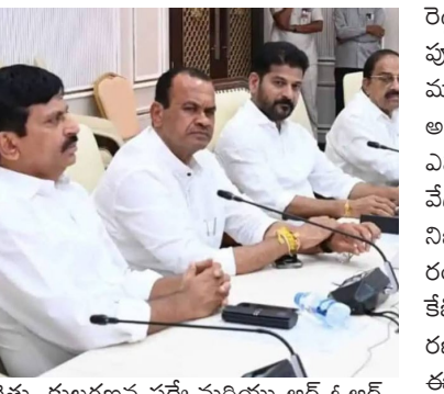
రెత్తు, కులగణన సర్వేమరియు ఆర్ ఓఆర్ చట్టంపై చర్చ జరగనుంది. ప్రభుత్వం ఇప్పటికే అనేక కీలక అంశాలను ఈ సమావేశాల్లో ముందుకు తీసుకురావడానికి ప్రారంభం కానున్నాయి. ఈ సమావేశాల్లో

రెడ్డి ప్రభుత్వం తన పదవీకాలంలో ఏడాది పూర్తి చేయనుంది. ఈ సందర్భంగా మంత్రివర్గ విస్తరణకు గ్రీన్ సిగ్నల్ ఇచ్చే అవకాశాలు కనిపిస్తున్నాయి. మహారాష్ట్ర ఎన్నికల ఫలితాల అనంతరం ఈ ప్రక్రియ వేగం పుంజుకోవడం తెలుస్తోంది. నిజామాబాద్, ఆదిలాబాద్, హైదరాబాద్, రంగారెడ్డి వంటి జిల్లాలకు ప్రస్తుతం కేబినెట్లో ప్రాతినిధ్యం లేకపోవడం, విస్తరణను మరింత కీలకంగా మారుస్తోంది. ఈ మంత్రివర్గ విస్తరణలో మైనార్టీలకు ప్రాధాన్యత ఇవ్వాలని యువతకు అధిక అవకాశాలు కల్పించాలని ప్రభుత్వం నిర్ణయించింది. ముఖ్యంగా