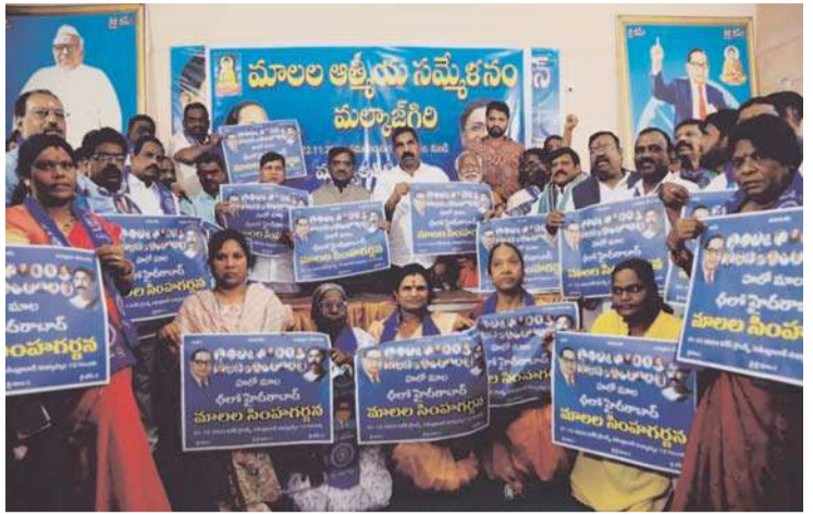
మలాజిగిరి సీలగిరి వార్త ప్రతినిధి

హైదరాబాద్ లోని పెరేడ్ గ్రౌండ్ లో డిసెంబర్ 1న జరిగే మాలల సింహ గర్జనను విజయవంతం చేయాలని చెన్నూరు నియోజకవర్గ ఎమ్మెల్యే వివేక్ వెంకటస్వామి కోరారు.