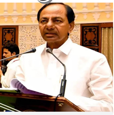
పార్టీ మాలిన బీఆర్ఎస్ ఎమ్మెల్యేలకు ఎదురుదెబ్బ