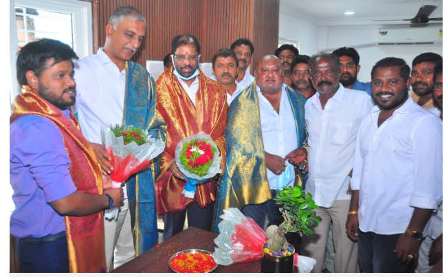
టీఆర్ఆర్ ఆసుపత్రిని సందర్శించిన మాజీ మంత్రులు