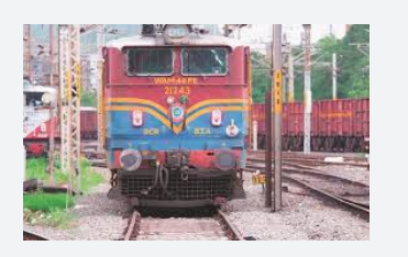
డిసెంబర్లో రైల్వే గుర్తింపు సంఘం ఎన్నికలు