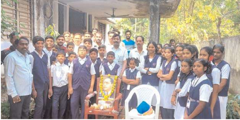
కామారెడ్డి జిల్లా ప్రతినిధి: నీలగిరి వార్త:

పాల్గొన్న స్టార్ చిల్డ్రన్ హైస్కూల్ విద్యార్థులు