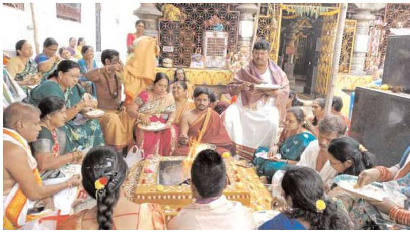
వరంగల్ బ్యారో నీలగిరి వార్త.