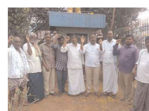
లోని పౌరుల హక్కులు, విధులను రాజ్యాంగం నిర్ణయిస్తుంది. ఇది ప్రభుత్వంలోని వివిధ హక్కులు, విధులను కూడా