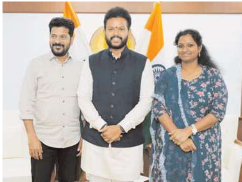
వరంగల్ బ్యారో నీలగిరి వార్త.

కేంద్ర పౌర విమానయన శాఖ మంత్రి కింజారపు రామ్మోహన్ నాయుడుని ముఖ్యమంత్రి రేవంత్ రెడ్డి తో కలిసి వరంగల్ పార్లమెంట్ సభ్యులూ డాక్టర్ కడియం కావ్య మర్యాద పూర్వకంగా కలిశారు. ఈ సందర్భంగా తెలంగాణ రాష్ట్రంలో నాలుగు కొత్త విమానాశ్రయాల ఏర్పాటుపై మంత్రి తో చర్చించారు. ముఖ్యంగా వరంగల్ మామూనూరు విమానాశ్రయం పనులు త్వరితగతిన పూర్తి చేసి విమాన రాకపోకలు ప్రారంభించాలని ఎంపీ డాక్టర్ కడియం కావ్య మంత్రిని అభ్యర్థించారు. దీనికి మంత్రి వరంగల్ విమానాశ్రయ ఏర్పాటుకు అన్ని విధాలా అనుకూలంగా ఉందని రోడ్డు కనెక్టివిటీ, మౌలిక వసతులు, భూ సేకరణ పూర్తి చేస్తే రెండు ఏళ్లలో విమానాల రాకపోకలు ప్రారంభించేందుకు సిద్ధంగా ఉన్నట్లు కేంద్ర రామ్మోహన్ నాయుడు తెలిపారు. దీనిపై ముఖ్యమంత్రి రేవంత్ రెడ్డి వరంగల్ నాగరాణి రాష్ట్ర రెండవ రాజధానిగా అభివృద్ధి చేసేందుకు ఇటీవలే వరంగల్ పట్టణ సమగ్ర అభివృద్ధికి మార్గం ప్లాన్, ఓఆర్ఆర్, విమానాశ్రయ ఏర్పాటుకు 4వేల కోట్ల రూపాయలను విడుదల చేసినట్లు తెలిపారు. వరంగల్ విమానాశ్రయ ఏర్పాటుకు కావాల్సిన మౌలిక వసతుల కల్పనకు అన్ని విధాలా సహకారం అందిస్తామని అన్నారు. దీనిపై సానుకూలంగా స్పందించిన పౌర విమానయన శాఖ మంత్రి రామ్మోహన్ నాయుడు రెండు సంవత్సరాలలో విమానాల రాకపోకలు ప్రారంభం అయ్యే విధంగా కృషి చేస్తానని హామీ ఇచ్చారు. దింకో కేంద్ర మంత్రి రామ్మోహన్ నాయుడు కి, ముఖ్యమంత్రి రేవంత్ రెడ్డి కి, ఎంపీ రేవంత్ రెడ్డి అధారితీకి ఎంపీ డాక్టర్ కడియం కావ్య ప్రత్యేక కృతజ్ఞతలు తెలిపారు.