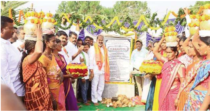
నీలగిరి వార్త వేములవాడ ప్రతినిధి

రాజన్న సిరిసిల్ల జిల్లా వేములవాడ నియోజకవర్గ పరిధిలోని కొనరావుపేట మండలం మంగళవారం గ్రామంలో 1 కోటి 30 లక్షలతో బీడీ రోడ్డు నిర్మాణానికి, 1 కోటి 90 లక్షలతో కొలనూరు రామన్నపేట మధ్య రోడ్డు ట్రిప్లీ నిర్మాణానికి మల్లాపేట గ్రామంలో 90 లక్షల తో సీసీ రోడ్డు నిర్మాణానికి శంకుస్థాపన కార్యక్రమంలో ప్రభుత్వ విప్ ఆది శ్రీనివాస్ 13 వసులకు 13 కోట్ల 40 లక్షలతో వివిధ పనులకు శంకుస్థాపన నిర్వహించడం జరిగింది రుద్రంగి మండల కేంద్రంలో 1 కోటి 50 లక్షలతో అంబేద్కర్ చార్జి నుండి ఇందిరా చౌక్ వరకు బీడీ రోడ్డు నిర్మాణానికి 62 లక్షలతో రామకృష్ణాపూర్ పల్లె వద్ద కల్లర్లు నిర్మాణానికి శంకుస్థాపన కార్యక్రమంలో ప్రభుత్వ విప్ ఆది శ్రీనివాస్ ముఖ్యఅతిథిగా హాజరై భూమి పూజ నిర్వహించారు ఈ కార్యక్రమంలో ప్రజాప్రతినిధులు మాజీ సర్పంచులు కాంగ్రెస్ కార్యకర్తలు ప్రజలు పాల్గొన్నారు.