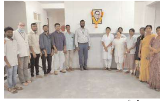
రాజ్యాన్ని అందించాలన్నారు. రాజ్యాంగం అంటే కేవలం రాత పద్ధతి కాదని, ఒక జాతి జీవన విధాన మనీ, దేశమంతటికీ నిరంతర వైతన్య సూర్తి అని డాక్టర్ బి.ఆర్ అంబేద్కర్ అన్నారు. జనం కోసం జీవినే, జనం హ్యదయాల్లో నిలిచిపోతారని