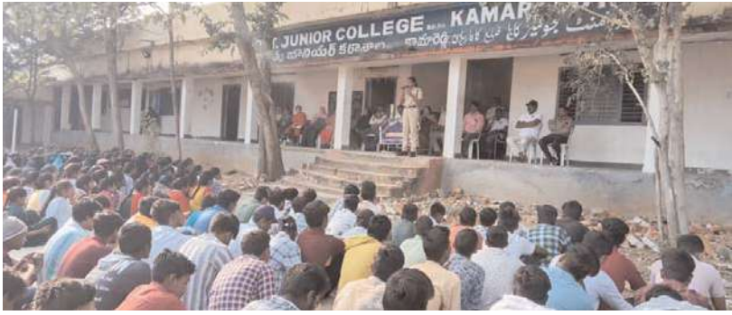
కామారెడ్డి జిల్లా ప్రతినిధి: నీలగిరి వార్త:

దేవునిపల్లి పరిధిలో మంగళవారం జూనియర్ కళాశాల నందు కళాబృందం ప్రోగ్రాం నిర్వహించిననది. కార్యక్రమములో పీ టీం, సైబర్ క్రైమ్, ఏ హాక్ టీ యు గురించి అవగాహన కల్పించినది. పీ టీం నెం. 8712686094, సైబర్ నేరాల పట్ల టోల్ ఫ్రీ నెంబర్ 1930కు కాల్ చేసి వినియోగించుకోవలసిన చెబుతూ, అత్యవసర పరిస్థితులలో టోల్ ఫ్రీ నెంబర్లు 100, 108, 1930, 181 ల విలువలు తెలుపవలెనని. ప్రతి మహిళా పోస్ నందు టీ-సెఫ్ యాప్ డౌన్లోడ్ చేసుకోవాలి ఇది మహిళలకు చాలా అత్యవసరమైనది అని తెలుపడం జరిగింది. ఇట్టి కార్యక్రమానికి పి ఎస్ సిబిఎం ఏ ఎస్ ఐ మరియు కళాబృందం సభ్యులు, విద్యార్థిని విద్యార్థులు, పాఠశాల సిబ్బంది పాల్గొన్నారు.