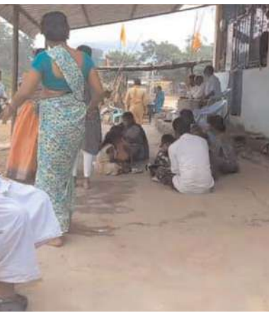
కార్యదర్శులు, కమిటీ మెంబర్లు తదితరులు కొరారు.

ప్రకాశం జిల్లా, పెద్ద దోర్నాల మండలం, వై. చెర్లొపల్లి గ్రామం, మోట్ల మల్లికార్జునపురం నందు వెలసిన అవధూత కాశి నాయన ఆశ్రమం నందు నిత్య అన్నదాన కార్యక్రమం నిర్వహిస్తున్నారు. శ్రీశైలంవెళ్ళే భక్తులకు, ప్రజలకు, కర్నూల్ గుంటూరు వైళ్ళే ప్రయాణి కులకు, శివ స్వాములు, అయ్యప్ప స్వాములు, భవని స్వాములు, అందరూ అన్నదాన కార్యక్రమం నాన్ని సద్విమోచనం చేసుకోవాలని అవధూత కాశి నాయన సేవా సంఘం వారు కోరారు. నిత్య అన్నదాన కార్యక్రమం నిర్వహిస్తున్నారూ. ప్రతి ఒక్కరూ ఈ అన్నదాన కార్యక్రమాన్ని సద్విమోచనం చేసుకోవాలని, అవధూత కాశి నాయన ఆశిస్సులు పొందాలని, అవధూత కాశి నాయనసేవా సంఘం, అధ్యక్షులు ఉపాధ్యక్షులు, కార్యదర్శులు, కమిటీ మెంబర్లు తదితరులు కోరారు.