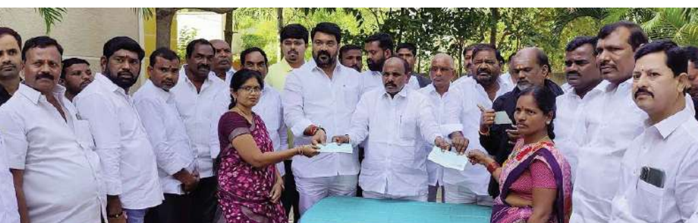
నియోజకవర్గం చేవెళ్ళ: శాసనసభ్యులు కాలే