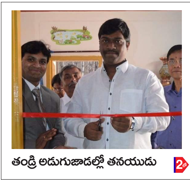
తండ్రి అడుగుజాడల్లో తనయుడు