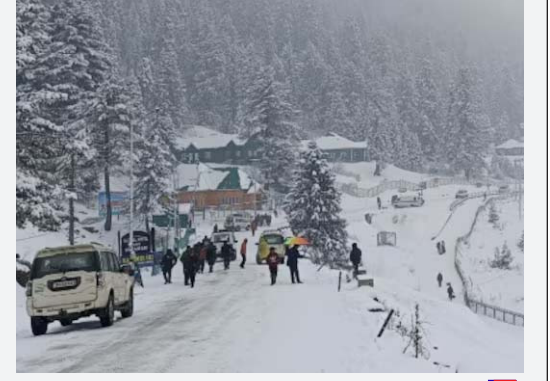
చలితో ఉత్తరాది గజగజ

ఏపీ & తెలంగాణ | ఎడిటర్ : గుంటోజు విష్ణుమూర్తి | శుక్రవారం | 27-12-2024 | సంపుటి : 15 | సంచిక : 167 | పేజీలు : 12 | వెల : 5/- | అసోసియేట్ ఎడిటర్ : చెన్నూరి అన్వేషి