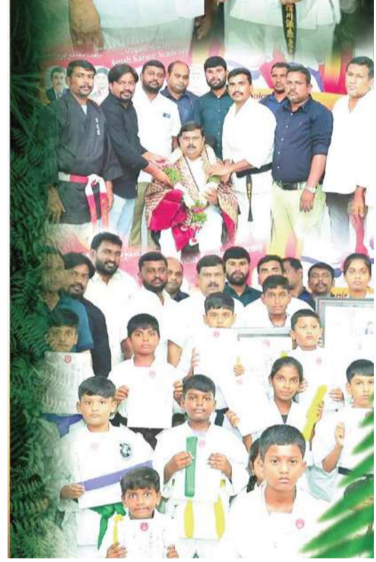
దేవరకొండ నీలగిరి వార్త