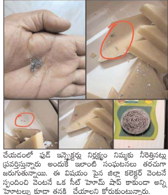
చేయడంలో ఫుడ్ ఇన్వెక్టర్లు నిర్లక్ష్యం నిమ్మకు నీరత్తిపట్టు ప్రవర్తిస్తున్నారని అందుకే ఇలాంటి సంఘటనలు తరచుగా జరుగుతున్నాయి. ఈ విషయం పైన జిల్లా కలెక్టర్ వెంటనే స్పందించి వెంటనే ఒక సీట్ హోమ్ షాప్ కాకుండా అన్ని హోటళ్ళు కూడా తనిఖీ చేయాలని కోరుకుంటున్నారు.

ద్వారానే ఇలాంటివి తరచూ జరుగుతున్నాయని బాధితులు ఆవేదన. ధీర్జీ వాల స్టేట్స్ షాప్ లో స్టాల్స్ తీసుకెళ్లి ఇంటికి వెళ్లి స్టేట్ బాక్స్ తీసి చూస్తే స్టేట్స్ లో స్టాల్స్ ప్రొబ్లమ్స్ రావడం ఏంటని ఆవేదన వ్యక్తం చేస్తున్నారు. ఒకవేళ ముందుగా చిన్న పిల్లలు తిని ఉంటే చిన్నపిల్లలు చనిపోతే పరిస్థితి ఉండేదని, ముఖ్యంగా చెప్పాలంటే ఫుడ్ ఇన్వెక్టర్ తనిఖీ లేకపోవడం ద్వారానే ఇలాంటి సంఘటనలు తరచుగా జరుగుతున్నాయని ఆవేదన వ్యక్తం చేస్తున్నారు. ఇలాంటి ధీర్జీ వాల స్టేట్స్ షాప్ లు వెంటనే మూసివేయాలని డిమాండ్ చేస్తున్నారు. అసలు కామారెడ్డిలో స్టేట్ షాప్ పెట్టాలంటే నిబంధనలకు అతీతంగా స్టేట్ షాప్స్ పెడుతున్నారు, కానీ షాపులను తనిఖీ