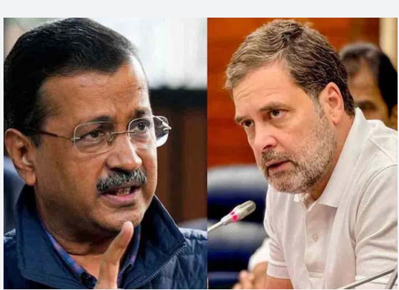
ఇండియాలో కూటమిలో భగ్గుమన్న విభేదాలు