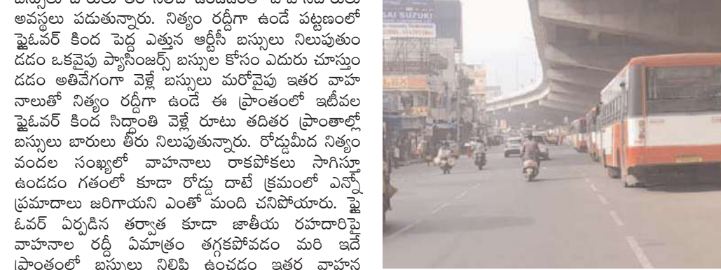
నిలిపి ఉండడంతో వాహనదారులు నిత్యం అవస్థలు పడుతూ ఆందోళన చెందుతున్నారు. హెలాల్ట్ ముందు వ్యాపార సంస్థల ముందు ఇలా వాహనాలు హిస్టోరియా నిలుపుతుండడంతో ఏ ప్రమాదం ఎప్పుడు ముంచుకొస్తుందోనని ఆందోళన చెందుతున్నారు. ఇప్పటికైనా అధికారులు దృష్టి సారించి షేడర్ కింద ప్రాంతంలో వాహనాలు నిల్వకుండా ఆ మార్గం ఉండే వాహనాలు సులభంగా వెళ్లిపోయే విధంగా చూడాలని కోరుతున్నారు.

రాజేంద్రనగర్, డిసెంబర్ 2, (నీలగిరి వార్త)