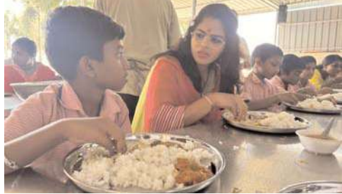
కామారెడ్డి జిల్లా ప్రతినిధి: నీలగిరి వార్త: