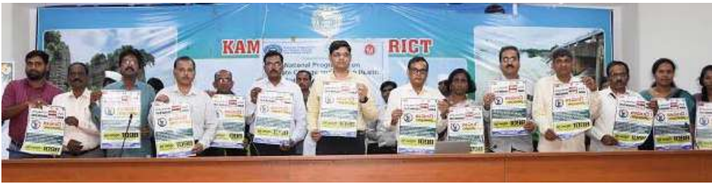
జిల్లా కలెక్టర్ ఆశిష్ సాంగ్వాస్