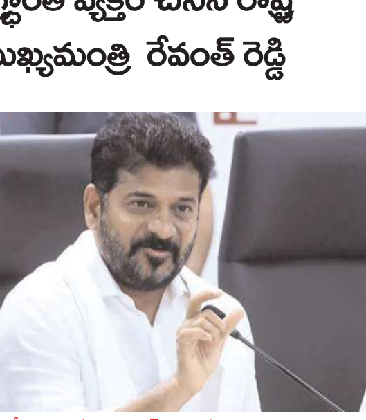
నీలగిరి వార్త వికారాబాద్ జిల్లా ప్రతినీధి