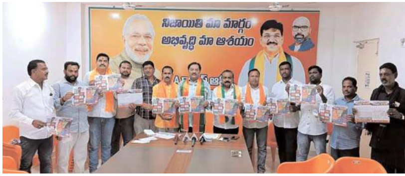
ఆర్కాడ్ ప్రతినిధి డిసెంబర్ 2 : (నీలగిరి వార్త)