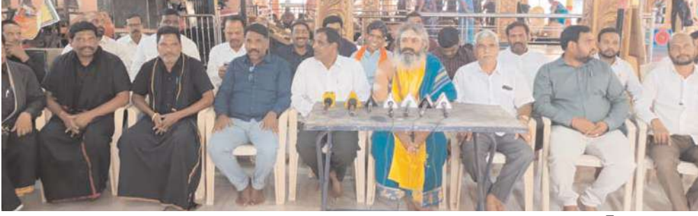
హిందూ ఐక్య వేదిక అధ్యక్షుల డిసెంబర్ 4 న