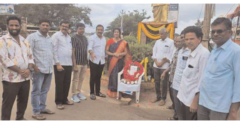
నీలగిరి వార్త వికారాబాద్ జిల్లా ప్రతినీధి