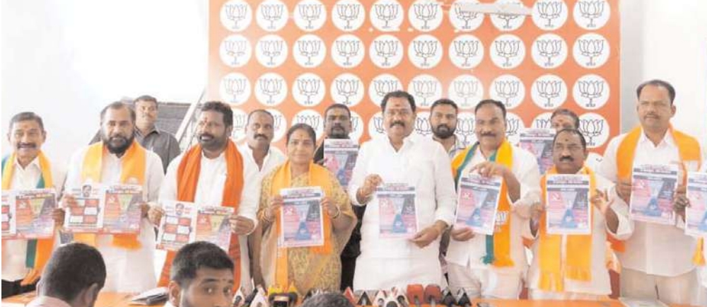
తెలంగాణ ప్రజల పరిస్థితి పెనంపై నుండి