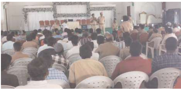
కామారెడ్డి జిల్లా ప్రతినిధి: నీలగిరి వార్త: