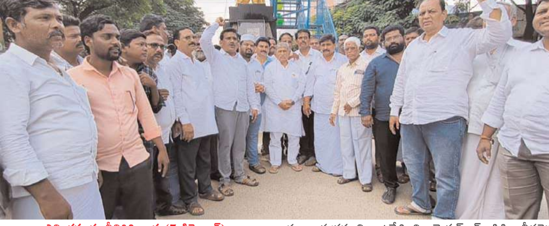
ఎమ్మిగనూరు సీలగిరి వార్త (7 డిసెంబర్)

వైయస్ఆర్ సిపి ఎమ్మిగనూరు నియోజకవర్గ ఇంచార్జ్ బుట్టా రేణుక ఆదేశాల మేరకు ఎమ్మిగనూరు పట్టణంలో డాక్టర్ వైయస్ రాజశేఖర్ రెడ్డి కూడలి నందు రాజశేఖర్ రెడ్డి విగ్రహాన్ని అవమానించిన గుర్తు తెలియని దుండగులను శిక్షించాలని ఎమ్మిగనూరు పట్టణ సిఐ గారికి వైయస్ఆర్ సిపి శ్రేణులు ఫిర్యాదు చేసి డాక్టర్ వైయస్ రాజశేఖర్ రెడ్డి గారి విగ్రహానికి పాలాభిషేకం చేయడం జరిగింది.