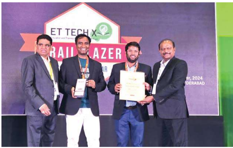
కామారెడ్డి జిల్లా ప్రతినిధి: నీలగిరి వార్త: