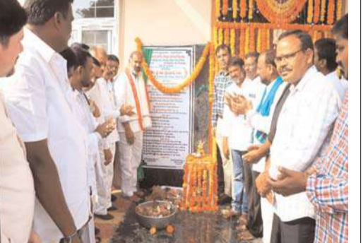
సభ్యులు మాజీ సర్పంచులు మార్కెట్ కమిటీ డైరెక్టర్లు కాంగ్రెస్ కార్యకర్తలు ప్రజలు పాల్గొన్నారు.