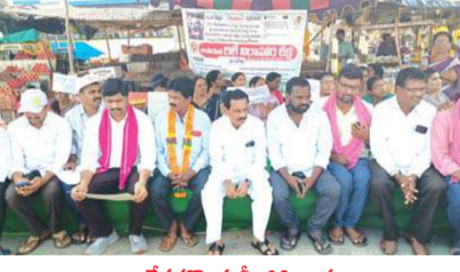
దేవరకొండ నీలగిరి వార్త

తెలంగాణ సమగ్ర శిక్షా ఉద్యోగులను రెగ్యులర్ చేయాలి సమగ్ర శిక్షా ఉద్యోగులకు 12 నెలల జీతాలు అందించాలి- పనికి తగిన వేతనం అందించాలి దేవరకొండ మాజీ ఎమ్మెల్యే రమావత్ రవీంద్ర కుమార్