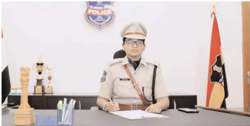
కామారెడ్డి జిల్లా ప్రతినిధి: నీలగిరి వార్త:

కామారెడ్డి జిల్లా పోలీస్ పరిధిలోని కామారెడ్డి, ఎల్లారెడ్డి, బాన్సువాడ డివిజన్ పరిధిలోని అన్ని పోలీస్ స్టేషన్స్ పరిధిలోని ప్రజలకు ఎలాంటి ఫిర్యాదు ఉన్నాడో సంబంధిత పోలీస్ అధికారులను సంప్రదించగలరు. అట్టి ఫిర్యాదు పై చర్యలు తీసుకోని యెడల సంబంధిత సి.ఐ.కి అట్టి ఫిర్యాదు గురించి తెలియజేయగలరు. అక్కడ కూడా చర్యలు తీసుకోనియెడల సంబంధిత డి.ఎస్.పి కి అట్టి ఫిర్యాదు గురించి తెలియజేయగలరు. అక్కడ కూడా తగు చర్యలు తీసుకోనట్లయితే చివరికి జిల్లా పోలీస్ కార్యాలయంలోని సెంట్రల్ కాంప్లెక్స్ సెల్ నెంబర్ : 8712686142 కు ఫోన్ కాల్ ద్వారా గాని వాట్సాప్ ద్వారా గాని సంప్రదించగలరు. ఇందుకోసం అన్ని పోలీస్ స్టేషన్స్ ముందు భాగంలో ఒక బోర్డు మీద సంబంధిత పోలీస్ అధికారుల ఫోన్ నెంబర్ పొందవచ్చు. బోర్డు రూపంలో ఏర్పాటు చేయడం జరిగింది. కావున ఫిర్యాదు దారులకు సంబంధించిన ఏలాంటి ఫిర్యాదును అయిన సంబంధిత పోలీస్ స్టేషన్స్ యందు సంప్రదించగలరు. పోలీస్ స్టేషన్ కు వచ్చే ఫిర్యాదుదారులతో మర్యాదతో మాట్లాడి వారి ఫిర్యాదును త్వరితగతిన చర్యలు తీసుకునే విధంగా సంబంధిత అధికారులకు కామారెడ్డి జిల్లా ఎస్సీ శ్రీమతి సి.సి.యస్. ఆదేశాలు జారీచేయడం జరిగింది.