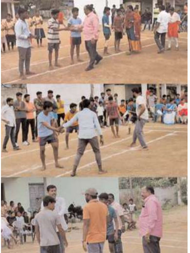
ప్రతిభవారి క్రీడాకారులను ఈ నెల 10, 11, 12 తేదీల్లో మండలస్థాయిలో నిర్వహించే పోటీలకు ఎంపిక చేయనున్నట్లు తెలిపారు. జిల్లాస్థాయిలో నిర్వహించనున్న పోటీలకు మండల స్థాయిలో ప్రతిభచాటి క్రీడాకారులను జిల్లాస్థాయికి ఎంపిక చేస్తారు. జిల్లాస్థాయిలో 20 క్రీడాకారుల పోటీలను నిర్వహించి అక్కడ ప్రతిభ చాటి క్రీడాకారులను రాష్ట్రస్థాయిలో నిర్వహించే పోటీలకు ఎంపిక చేయనున్నారు. ఈ కార్యక్రమంలో ఆయా గ్రామ పంచాయితీ సెక్రటరీలు, గ్రామ ప్రజలు, యువకులు, మహిళలు తదితరులు పాల్గొన్నారు.

రాష్ట్ర ప్రభుత్వం ప్రతిష్టాత్మకంగా చేపట్టిన సీఎం కవ్ క్రీడా పోటీలకు ముదిగొండ మండలంలోని పలు గ్రామాల ముస్సాయియ్యలు ఈ పోటీలలో భాగమై ఎమ్మకెఆర్ రమణయ్య మాట్లాడుతూ గ్రామస్థాయి యువతలో దాగి ఉన్న క్రీడా ప్రతిభను వెలికితీసి వారిని రాష్ట్ర, జాతీయ, అంతర్జాతీయ స్థాయి క్రీడాకారులుగా తీర్చిదిద్దాలని పోటీలు నిర్వహిస్తున్నారన్నారు. ఇందులో భాగంగా ముదిగొండ మండలంలోని మాదాపురం, ముదిగొండ, బాణాపురం, పెద్ద మండవ, వల్లభి, పమ్మి, గోకినపల్లి, వనంవారి కిష్టాపురం గ్రామాలలోని పాఠశాలలో ప్రధానోపాధ్యాయులు, పంచాయితీ కార్యదర్శులు ఈ పోటీలను నిర్వహించినట్లు ఎమ్మకెఆర్ రమణయ్య, ఎంపీడిఓ శ్రీధర్ స్వామి తెలిపారు. అలాగే గ్రామస్థాయిలో