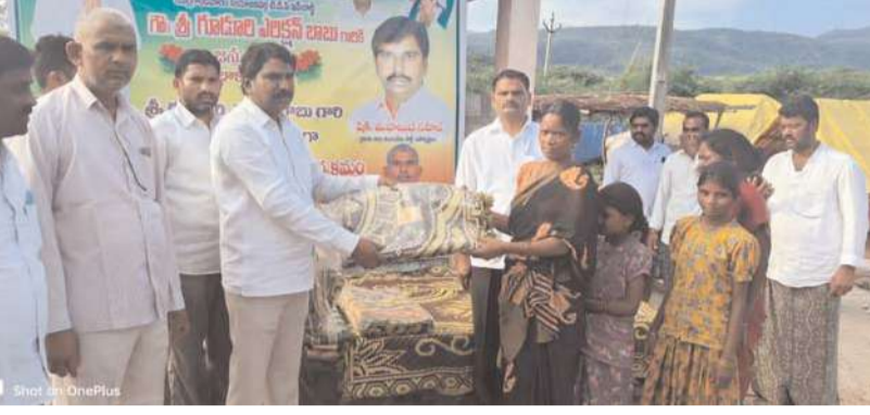
షెడ్యూల్డ్ కులాల సేవల కోసం డిసెంబర్ 7.