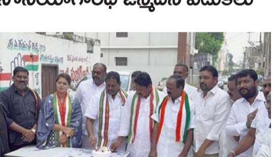
కామారెడ్డి జిల్లా ప్రతినిధి: నీలగిరి వార్త: