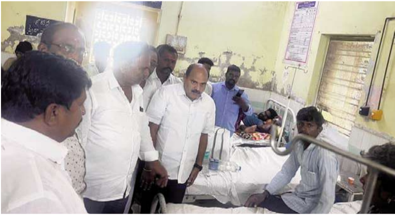
ఎమ్మిగనూరు సీలగిరి వార్త (9 డిసెంబర్)