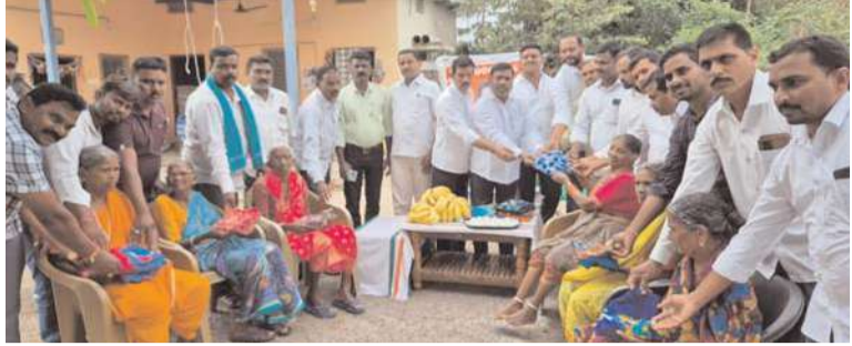
వరంగల్ జ్యూరీ నీలగిరి వార్త.