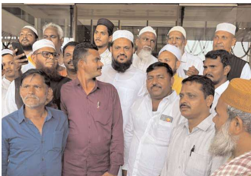
పెద్ద దోర్నాల సీలగిరి వార్త డిసెంబర్ 8.