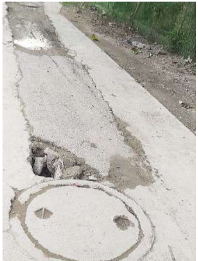
హాయత్ నగర్ సీలగిరి వార్త (డిసెంబర్ 9):

రంగారెడ్డి జిల్లా పెద్ద అంబర్ పేట పురపాలక సంఘం పరిధిలోని కల్లంప, శాంతి నగర్లో అంతర్గత రోడ్లు అధ్వాన్నంగా మారాయి. ధ్వంసమైన రోడ్లకు మరమ్మత్తులు చేయ కుండా వదిలిపె యడంతో కంకరతెలి ప్రమాదకరంగా మారుతున్నాయని హాహన దారులు, పాదచారులు, స్థానికులు అగ్రహం వ్యక్తం చేస్తున్నారు. 10వ,వార్డు శాంతి నగర్ రోడ్డు నెంబర్ 8లో రహదారి నడిరోడ్డు మధ్యలో కుంగిపోయింది. పెద్ద గొయ్యి ఏర్పడింది. గత రెండు నెలల తరబడి అలాగే ఉన్న మరమ్మత్తులు దేవుడెరుగు, ప్రమాదకర సూచికలైన ఏర్పాటు చేయకపోవడంతో అధికారు లపై, స్థానిక ప్రజాప్రతినిధులపై కాలనీ వాసులు అసహనం వ్యక్తం చేస్తున్నారు.