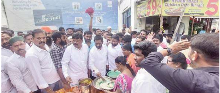
వరంగల్ జ్యూరీ నీలగిరి వార్త.

పెద్ద ఎత్తున హాజరైన కొండా అభిమానులు, తూర్పు కార్పొరేటర్లు, యూత్ కార్యకర్తలు, మహిళలు