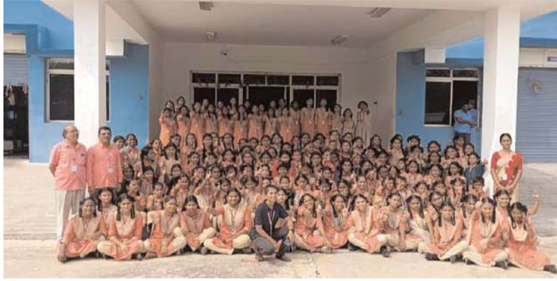
నీలగిరి వార్త, కొండమల్లెపల్లి: సానిక్ కొండమల్లెపల్లి పట్టణంలోని సాయి సిద్ధార్థ పాఠశాల విద్యార్థులు సోమవారం రోజున కోదండపురం వాటర్ షాంట్ ను సందర్శించడం జరిగింది.

సానిక్ కొండమల్లెపల్లి పట్టణంలోని సాయి సిద్ధార్థ పాఠశాల విద్యార్థులు సోమవారం రోజున కోదండపురం వాటర్ షాంట్ ను సందర్శించడం జరిగింది. విద్యార్థులలో త్రాగునీటి యొక్క అవశ్యకతను వివరించడం కొరకు పాఠశాల యాజమాన్యం వారు ఫిల్టర్ డ్రీమ్ చేయించడం జరిగింది. ఈ ఈ సందర్భంగా విద్యార్థులకు త్రాగునీటి యొక్క అవశ్యకత, నీటిని ఎలా సద్దాని యోగం చేసుకోవాలి అనే అంశాలపై వివరించారు. అలాగే అక్కడపల్లి రిజర్వాయర్ నుండి వచ్చిన నీటిని ఎలా శుద్ధి చేసి హైడ్రోజెన్ నగర వాసులకు మరియూ మిషన్ భగీరథ త్రాగునీరు ఎలా సమైక్య చేస్తారు అనే విషయాన్ని పూర్తిగా వివరించడం జరిగింది. త్రాగునీటి పై పూర్తి అవగాహన కల్పించినందుకు కొండపురం షాంట్ ముందుకు సీబిఎంకి పాఠశాల యాజమాన్యం వారు కృతజ్ఞత తెలిపారు. త్రాగునీటిపై ఇంతటి మంచి అవగాహన కల్పించినందుకు విద్యార్థులు సంతోషం వ్యక్తం చేశారు. పాఠశాల యాజమాన్యం మరియూ ఉపాధ్యాయులు పాల్గొన్నారు.