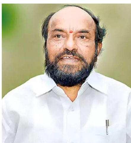
మీ గతా 2వ పేజీలో...

బ్యూరోచీఫ్ - నీలగిరివార్త : మూడు రాజ్యసభ స్థానాలకు బీజేపీ అభ్యర్థులను ప్రకటించింది. ఏపీ నుంచి ఆర్.కృష్ణయ్య, హర్యానా నుంచి రేఖా శర్మ, ఒడిశా నుంచి సుజిత కుమార్ పేర్లను ఖరారు చేసింది. బీసీ ఉద్యమ నేత కృష్ణయ్య ఇటీవల వైసీపీకి, రాజ్యసభ స్థానానికి రాజీనామా చేసిన విషయం తెలిసింది. ఇప్పుడు బీజేపీ ఆయనకు మరోసారి అవకాశం కల్పించింది. ఇక రాజ్యసభ ఉపఎన్నికల