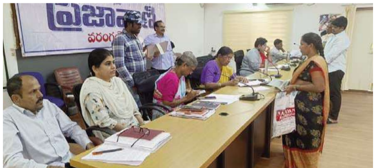
వరంగల్ జ్యూరీ నీలగిరి వార్త.