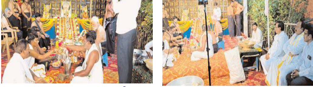
ఘనంగా అయ్యప్ప స్వామి మహాపడిపూజ మహోత్సవం