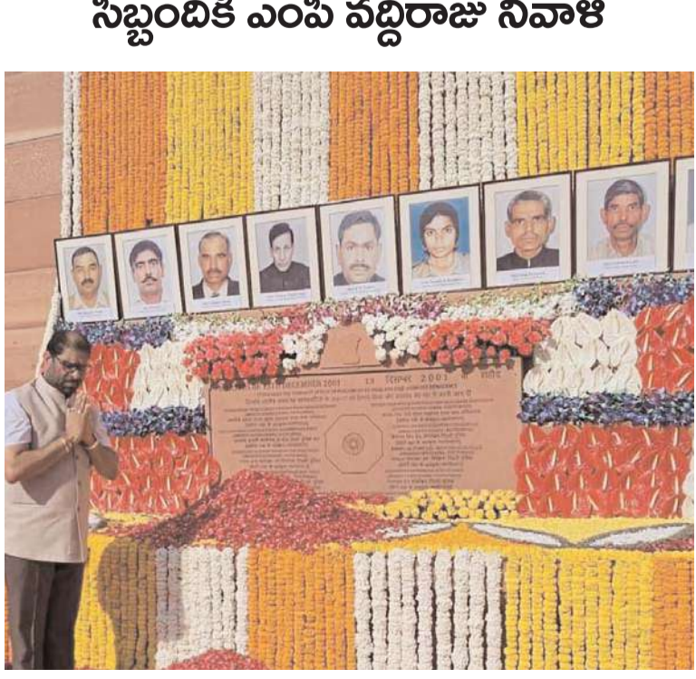
ఖమ్మం, సీలగిరి వార్త ప్రతినిధి డిసెంబర్ 13:

2001 డిసెంబర్ 13న పార్లమెంటుపై తీవ్రవాదులు జరిపిన దాడిలో మరణించిన పార్లమెంట్ స్పీకర్ మరియు భారత సభ్యుడికి బి ఆర్ ఎస్ పార్లమెంట్లో పార్టీ ఉపనేత పద్దిరాజు రవిచంద్ర శుక్రవారం పార్లమెంట్ అవరణలో వారి చిత్ర చటాలకు పుష్పాంజలి ఘటించి నివాళులర్పించారు.