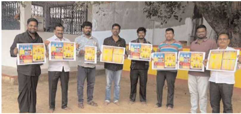
దేవరకొండ నీలగిరి వార్త