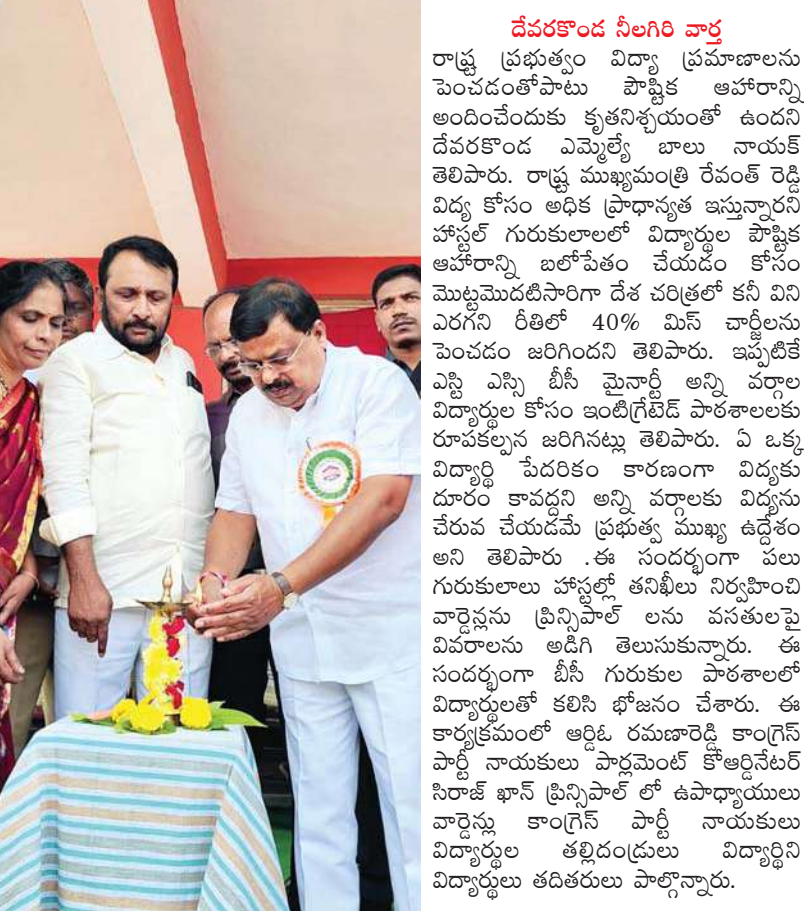
దేవరకొండ నీలగిరి వార్త

రాష్ట్ర ప్రభుత్వం విద్యా ప్రమాణాలను పెంచడంతోపాటు పాఠ్యకాహారాన్ని అందించేందుకు కృతనిశ్చయంతో ఉందని దేవరకొండ ఎమ్మెల్యే బాలు నాయక్ తెలిపారు. రాష్ట్ర ముఖ్యమంత్రి రేవంత్ రెడ్డి విద్య కోసం అధిక ప్రాధాన్యత ఇస్తున్నారని హాస్టల్ గురుకులాలలో విద్యార్థుల ఆహారాన్ని బలోపేతం చేయడం కోసం మొట్టమొదటిసారిగా దేశ చరిత్రలో కనీసం ఏరగని రీతిలో 40% మిన్ చార్జీలను పెంచడం జరిగిందని తెలిపారు. ఇప్పటికే ఎన్ని ఎన్ని బీసీ మెన్సార్జీ అన్ని వర్గాల విద్యార్థుల కోసం ఇంటిగ్రేటెడ్ పాఠశాలలకు రూపకల్పన జరిగినట్లు తెలిపారు. ఏ ఒక్క విద్యార్థి పేదరికం కారణంగా విద్యకు దూరం కావద్దని అన్ని వర్గాలకు విద్యను చేరువ చేయడమే ప్రభుత్వ ముఖ్య ఉద్దేశం అని తెలిపారు. ఈ సందర్భంగా పలు గురుకులాలు హాస్టల్లో తనిఖీలు నిర్వహించి వార్డెన్లను ప్రిన్సిపాల్ లను పసతులపై వివరాలను అడిగి తెలుసుకున్నారు. ఈ సందర్భంగా బీసీ గురుకుల పాఠశాలలో విద్యార్థులతో కలిసి భోజనం చేశారు. ఈ కార్యక్రమంలో ఆర్డీ రమణారెడ్డి కాంగ్రెస్ పార్టీ నాయకులు పార్లమెంట్ కోఆర్డినేటర్ నిరాజ్ ఖాన్ ప్రిన్సిపాల్ లో ఉపాధ్యాయులు వార్డెన్లు కాంగ్రెస్ పార్టీ నాయకులు విద్యార్థుల తల్లిదండ్రులు విద్యార్థిని తదితరులు పాల్గొన్నారు.