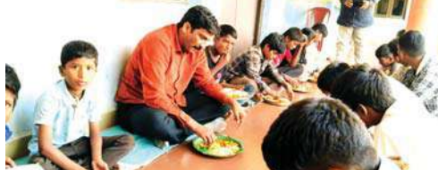
దేవరకొండ నీలగిరి వార్త

విద్యార్థులతో కలిసి భోజనం చేసిన తహసిల్దార్