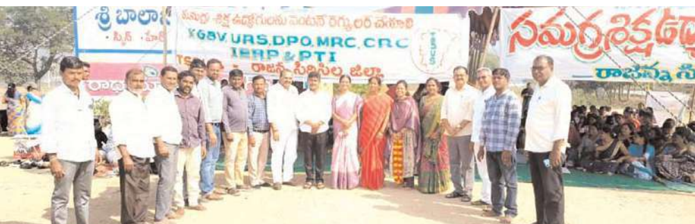
నీలగిరి వార్త వేములవాడ ప్రతినధి