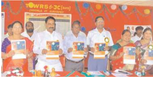
నీలగిరి వార్త, సూర్యాపేట:-