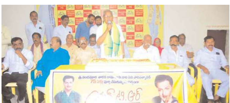
ఖమ్మం, నీలగిరి వార్త ప్రతినిధి డిసెంబర్ 14: