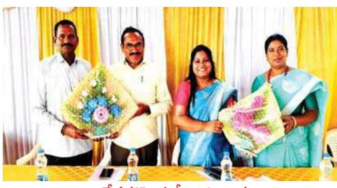
దేవరకొండ నీలగిరి వార్త