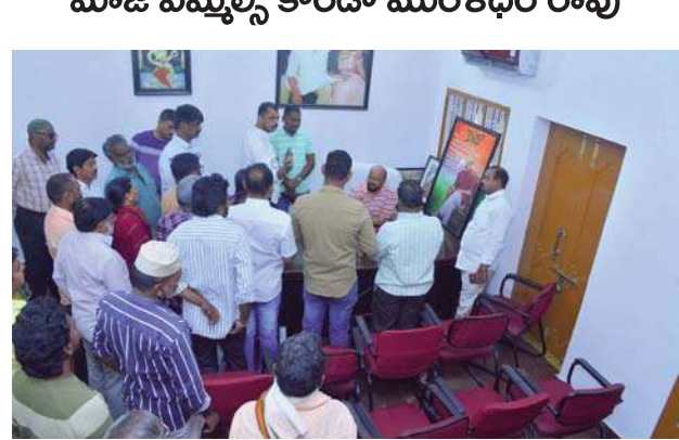
పరంగల్ బ్యారో నీలగిరి వార్త.