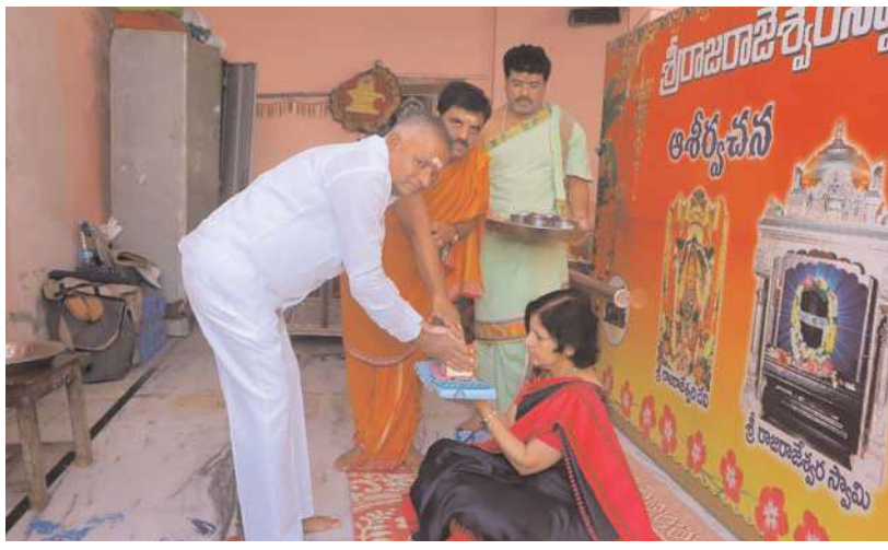
నీలగిరి వార్త వేములవాడ ప్రతినధి