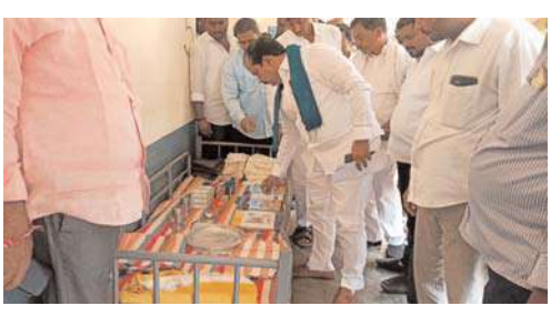
పరంగల్ బ్యారో నీలగిరి వార్త.