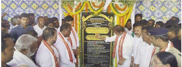
భూపాలపల్లి నీలగిరి వార్త.