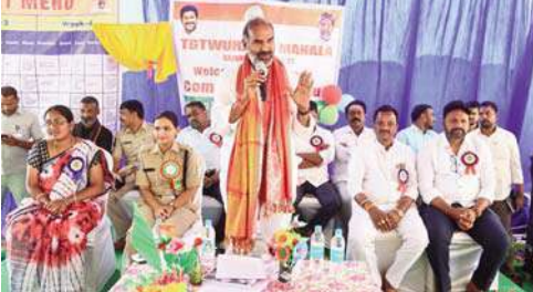
నీలగిరి వార్త వేములవాడ ప్రతినధి