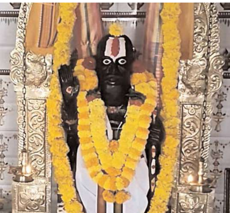
పెద్ద దోర్నాల సీలగిరి వార్డు డిసెంబర్ 15.