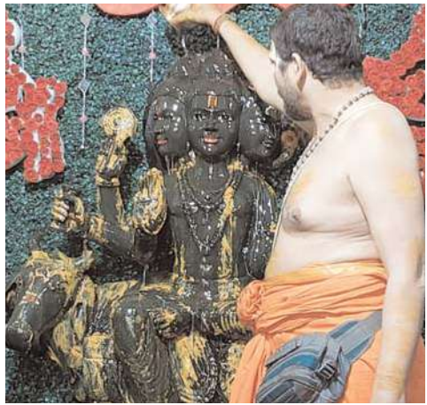
వరంగల్ జ్యూరో నీలగిరి వార్త.

తెలం తో పొద్దుపొద్దు రోజు గురువు లకి గురువైన అది గురు దత్తాత్రేయ స్వామి కీ వేలాది మంది భక్తుల దత్త నామస్తుతంతో అభిషేకం నిర్వహించుకున్నారు ఆదివారం శ్రీ దత్త జయంతి సందర్భంగా ములుగు రోడ్డు లోని శ్రీ గణపతి సచ్చిదానంద వరద దత్త క్షేత్రం లో కన్నుల పండువగా దత్తాత్రేయ జయంతి పర్వదిన వేడుకలు