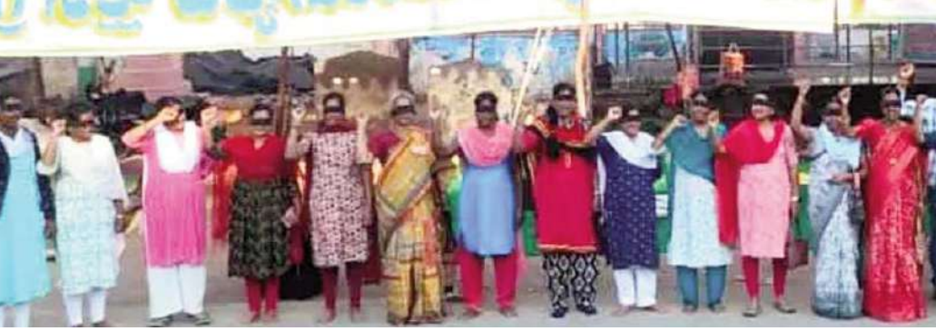
కామారెడ్డి జిల్లా ప్రతినిధి: నీలగిరి వార్త

నిరవధిక సమ్మెలో భాగంగా 6వ రోజు ఆదివారం సమగ్ర శిక్ష ఉద్యోగులు కక్ష గుంతులు కట్టుకుని నిరసన తెలిపారు. ప్రభుత్వం వెంటనే కక్ష తొలగించి తమకు న్యాయం చేయాలని డిమాండ్ చేశారు. సినిమా హీరో అల్లు అర్జున్ కారణంగా చనిపోయిన వ్యక్తి విషయంలో స్పందించిన తీరు బాగుందని, అలాగే సమగ్ర శిక్ష ఉద్యోగులకు ఉద్యోగాలుగా పని చేసే మరణం పొందిన వారికి ప్రభుత్వం నుంచి ఒక్క రూపాయి కూడా అందలేదని, వారి కుటుంబాలను ప్రభుత్వం ఆదుకోలేదని ఆవేదన వ్యక్తం చేశారు. అసెంబ్లీ సమావేశాల్లో తమ డిమాండ్ ను పరిష్కరించకుంటే రానున్న