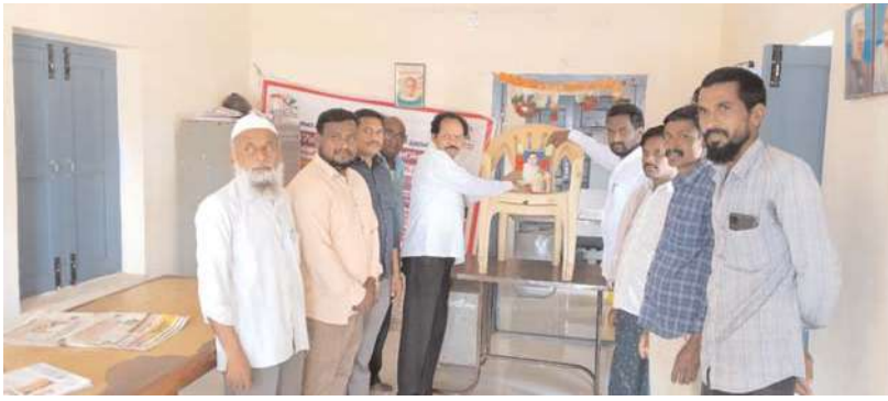
పెద్ద దోర్నాల సీలగిరి వార్డు డిసెంబర్ 15.