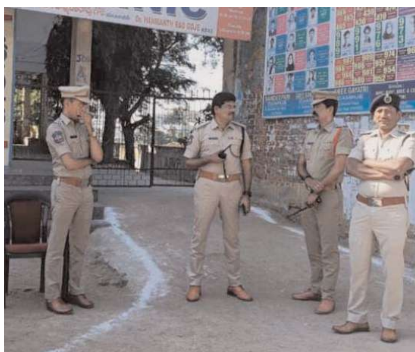
కామారెడ్డి జిల్లా ప్రతినిధి: నీలగిరి వార్త

గ్రూప్-2 పరీక్షలకు హాజరు శాతం సగం నమోదైంది. ఆదివారం నిర్వహించిన రెండు పరీక్షలకు అభ్యర్థులు అంతంతమాత్రంగానే హాజరయ్యారు. మొత్తం 8,085 మంది అభ్యర్థులు పరీక్ష రాయాల్ని ఉండగా.. ఉదయం 3,971 మంది హాజరు కాగా 4,114 మంది గైర్హాజరయ్యారు. మధ్యాహ్నం 3,917 మంది హాజరు కాగా.. 4,168 మంది పరీక్ష రాయలేదు. ఉదయం కంటే మధ్యాహ్నం 54 మంది ఎక్కువ గైర్హాజరయ్యారు. మొత్తంగా మొదటి రోజు 50 శాతం మాత్రమే హాజరయ్యారు. పరీక్ష కేంద్రాల వద్ద పోలీసుల బందోబస్తు కొనసాగింది. పరీక్ష కేంద్రాలను జిల్లా ఆడిషనల్ ఎస్పీ సర్పంచ్ రెడ్డి పరిశీలించారు.