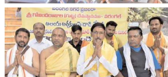
వరంగల్ జ్యూరో నీలగిరి వార్త.