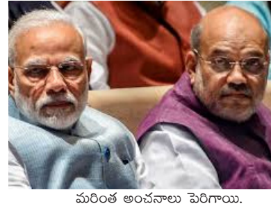
మరింత అంచనాలు పెరిగాయి.

చెన్నూరి అన్వేషి, బ్యూరోటీఫ్ - నీలగిరివార్త : తెలుగురాష్ట్రాల్లో బీజేపీ తన మార్క్ రాజకీయం మొదలుపెట్టింది. జమిలి దిశగా కేంద్రంలో కీలక పరిణామాలు చోటు చేసుకుంటున్నాయి. దక్షిణాది రాష్ట్రాల్లోనూ ఈ సారి తమ బలం చాటుకోవటం మోదీ - షా ద్వయానికి ప్రతిష్టాత్మకంగా మారుతోంది. ప్రతి అడుగు వ్యూహాత్మకంగా వేస్తున్నారు. అందులో భాగంగా తెలుగు రాష్ట్రాల్లోనూ కొత్త వ్యూహాలు అమలు చేస్తున్నారు. వచ్చే ఎన్నికల్లో లక్ష్యంగా తాజా కనరత్తు జరుగుతోంది. కీలక నియమాకాలకు సిద్ధం అవుతోంది.