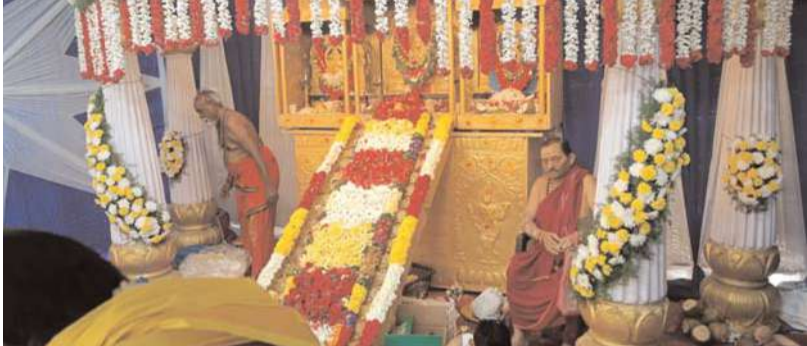
వరంగల్ జ్యూరో నీలగిరి వార్త.

అయ్యప్ప అభిషేకాన్ని కనులారా వీక్షించిన మూలధారులు. బీరన్న దేవాలయ ప్రాంగణంలో ప్రతిష్ఠించిన అయ్యప్ప శరణు ఘోష