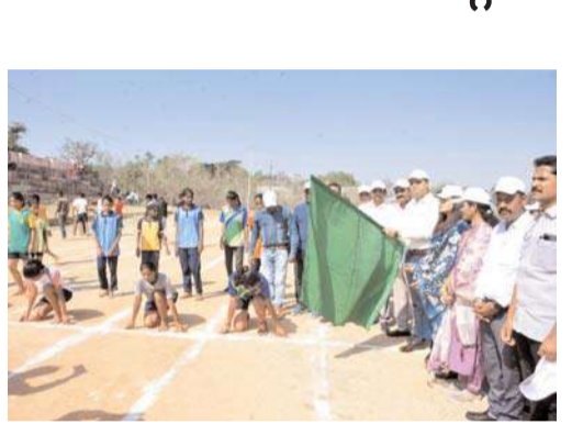
జిల్లా కలెక్టర్ ఆశిష్ సాంగ్వాన్