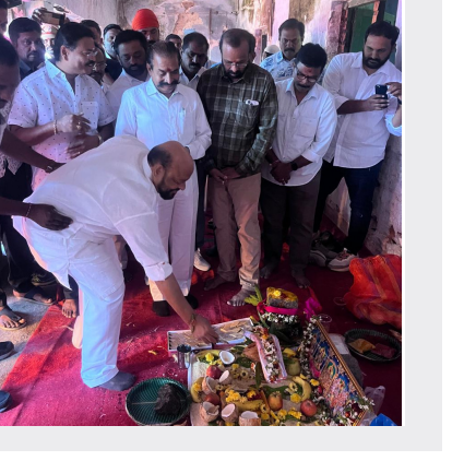
మిగతా 2వ పేజీలో...