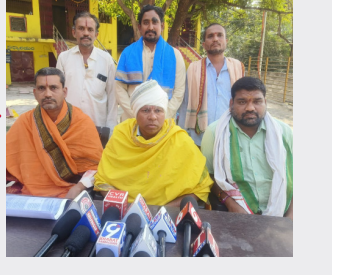
మిగతా 2వ పేజీలో...