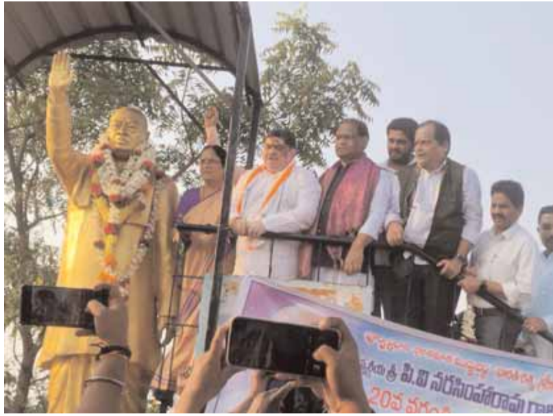
భీమవేరపల్లి నీలగిరి వార్త స్టూన్: