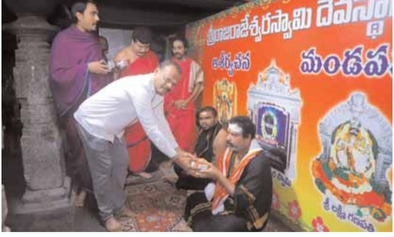
నీలగిరి వార్త వేములవాడ ప్రతినిధి