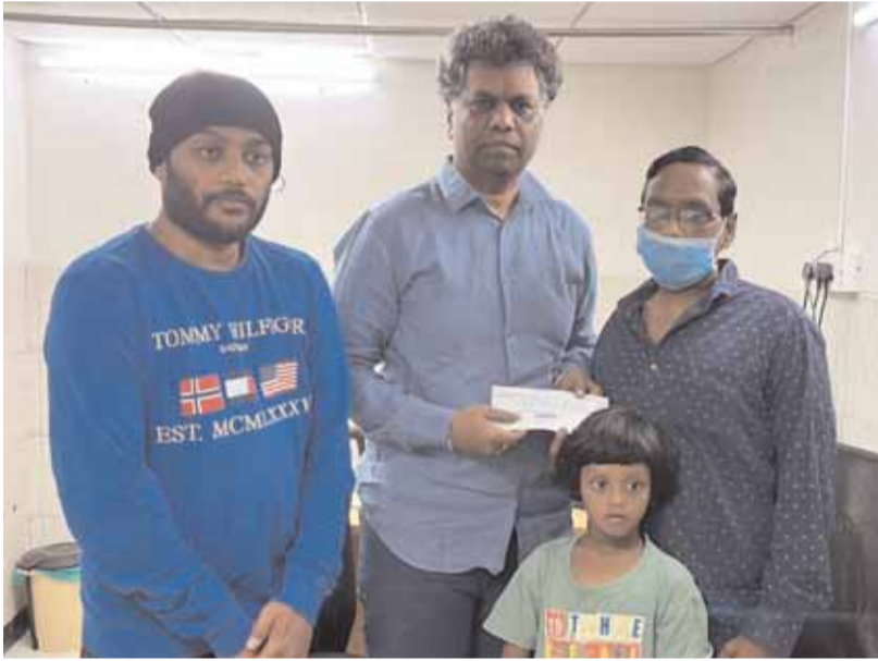
నీలగిరి వార్త వైదరాబాద్: