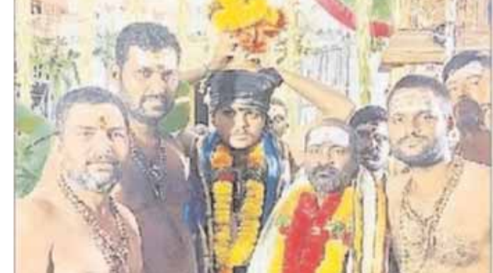
పెద్ద దోర్నాల నీలగిరి వార్త డి.సి.సి.ఎం. 23:

ప్రకాశం జిల్లా, పెద్ద దోర్నాల మండలం, దోర్నాల గ్రామంలో శ్రీశైలం పరమార్థి వేలసిన అయ్యప్ప స్వామిని, అయ్యప్ప స్వామి దేవాలయం నుండి ఊరేగింపుతో దోర్నాల పురపేటలో అంగరంగ వైభవంగా పులి వాహనంపై అయ్యప్ప స్వామిని తాళ మేళాలతో, దమ్మతో, హరిహరపుత్ర అయ్యప్ప, స్వామియే శరణమయ్యప్ప అంటూ భజన చేసుకుంటూ ఘనంగా గ్రామోత్సవం నిర్వహించారు. పంచరంగుల యెమ్మల దీపాలంకరణతో, అయ్యప్ప మాలాధారణ, అయ్యప్ప స్వాములు, హర హర పుత్రుడు అయ్యప్ప, శరణమయ్యప్ప, విల్లాల వీరనే, మణింకర స్వామి, నామస్కరన చేస్తూ స్వత్యం చేసుకుంటూ దోర్నాల పురపేటలో అంగరంగ వైభవంగా, కన్నుల పండుగా, గ్రామోత్సవం నిర్వహించారు, భక్తులు కాదు కప్పూరాలు. సమర్పించి తీర్చి ప్రసాదములు తీసుకున్నారు. ఈ కార్యక్రమంలో, గురుస్వాములు, అయ్యప్ప స్వాములు, కన్న స్వాములు, భక్తులు, ప్రజలు తదితరులు పాల్గొన్నారు.