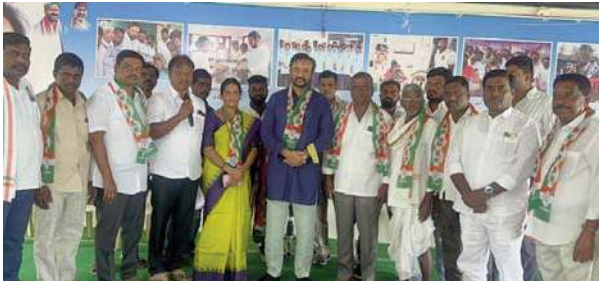
నీలగిరి వార్త ఎల్లారెడ్డి:-