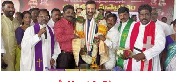
నీలగిరి వార్త ఎల్లారెడ్డి:-

ఎల్లారెడ్డి పట్టణ కేంద్రంలో వి కె వి ఫంక్షన్ హాల్ లో క్రైస్తవ సోదర సోదరిమణులతో క్రీస్తున్ వేడుకల్లో పాల్గొని క్రీస్తున్ కేక్ ని కట్టే చేసిన ఎమ్మెల్యే అనంతరం ఎమ్మెల్యే మాట్లాడుతూ కాంగ్రెస్ ప్రభుత్వం గెలిచిన నాటి నుండి క్రైస్తవులకు చాలా సహాయ సహకారాలు అందిస్తుందన్నారు. ప్రతి యేటా ఇలా క్రీస్తున్ సందరాలు ప్రభుత్వం తరఫున నిర్వహించడం చాలా ఆనందదాయకం అన్నారు. ఎల్లారెడ్డి నియోజకవర్గ క్రైస్తులందరికీ క్రీస్తున్ శుభాకాంక్షలు తెలియచేశారు.