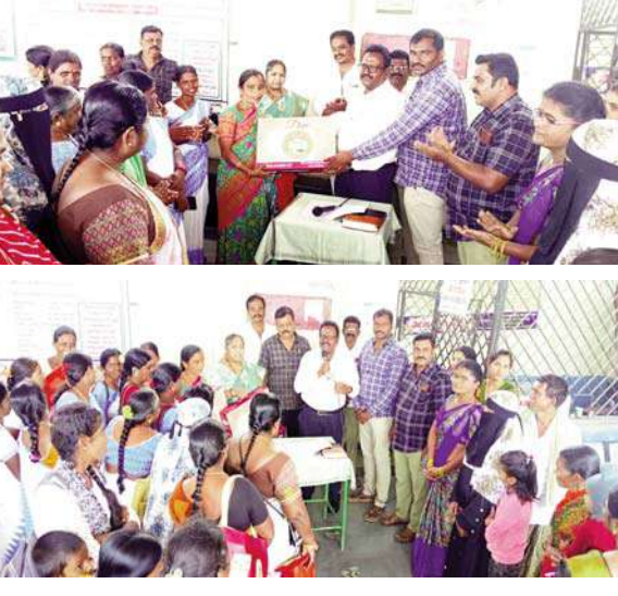
దేవరకొండ నీలగిరి వార్త