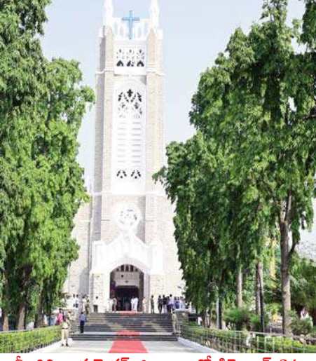
నీలగిరి వార్త:మెడక్ జిల్లా బ్యారో:డిసెంబర్ 24:

మెడక్ పట్టణంలో క్రిస్టన్ వేడుకలకు ముస్తాబైన సిఎస్ఐ చర్చ్ ఆసియా ఖండంలో ప్రఖ్యాతిగాంచిన మెడక్ కెత డ్రిల్ చర్చ్ విద్యుత్ కాంతలతో అంగరంగ వైభవంగా ముస్తాబయింది. శతాబ్ది ఉత్సవాల సందర్భంగా భక్తుల కోసం మౌలిక సదుపాయాల తో పాటు అన్ని రకాల ఏర్పాట్లు చేశారు. మెడటిసారిగా తెలంగాణ రాష్ట్ర ముఖ్యమంత్రి రేవంత్ రెడ్డి రాక సందర్భంగా భారీ బందోబస్తు పోలీస్ శాఖ ఏర్పాటు చేసింది. ఉదయం 4 గంటల సమయంలో మొదటి ప్రార్థనకు భక్తులు భారీగా తరలివచ్చారు. మొదటి ప్రార్థన కార్యక్రమంలో బిషప్ భక్తులను ఉద్దేశించి ప్రసంగిస్తారు. అందులో వేలాదిమంది భక్తులు ఆరాధనలో పాల్గొంటారు. ఏనుక్రీస్తు కీర్తనల పాటలతో మారం రోగుతుంది. ఆలయ ప్రాంగణంలో