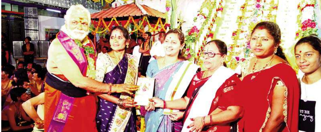
దేవరకొండ నీలగిరి వార్త