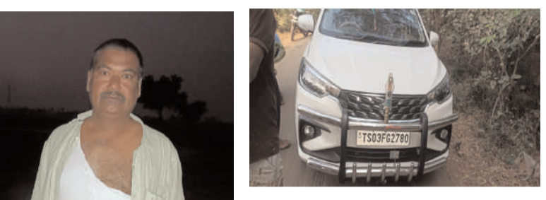
పిల్లతుర్తి మండలం నీలగిరి వార్త ప్రతినిధి డిసెంబర్ 28

తమ కారుకు సైడ్ ఇన్వేన్షన్లకు బైక్ మీద వెళుతున్న వ్యక్తిపై మద్యం మత్తులో తీవ్రమైన దాడి - సూరారం గ్రామ మాజీ ఉపసర్పంచ్ సింగం బోయిన బలయ్య పై దాడి - టూపీల్ బైక్, సెల్ఫోన్ రెండు తులాల బంగారం అమ్మకెళ్లడం గురించి