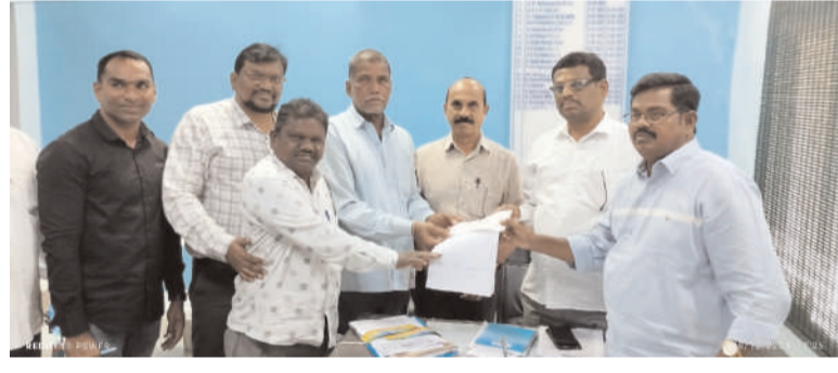
హనుమకొండ వరంగల్ కాజీపేట స్ట్రాటర్ హౌస్ లకు బహిరంగ వేలం