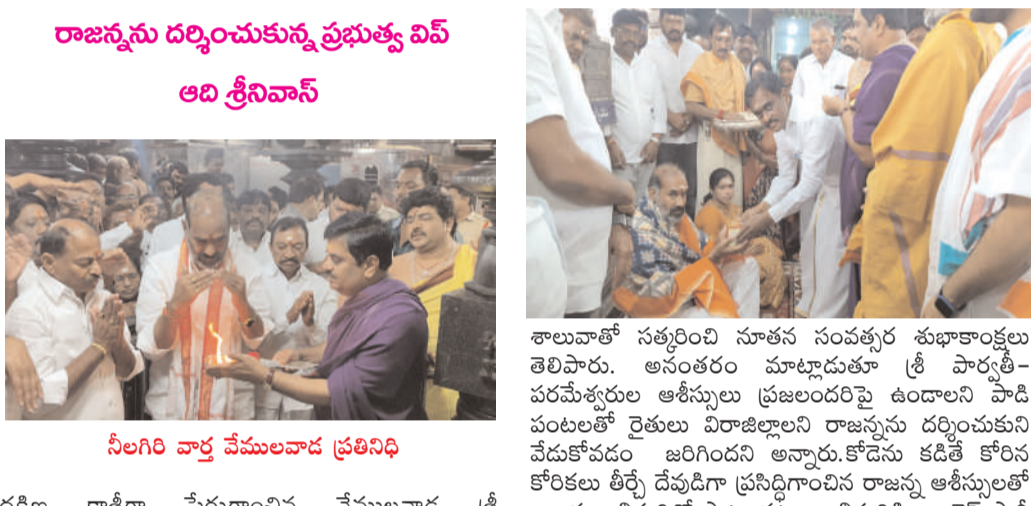
నీలగిరి వార్త వేములవాడ ప్రతినిధి