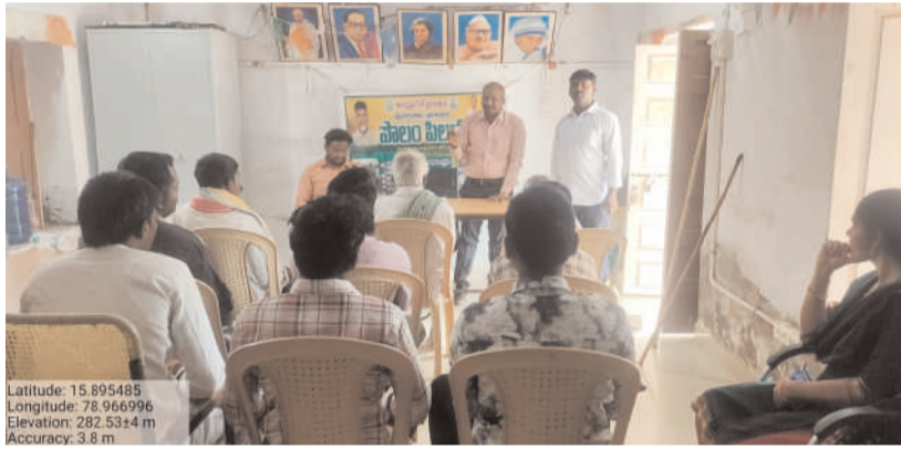
Latitude: 15.695485 Longitude: 78.966996 Elevation: 282.5344 m Accuracy: 3.8 m