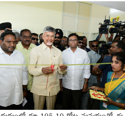
అభ్యర్థులలో రూ. 105.10 కోట్ల వ్యయంతో ఈ ప్రాసెసింగ్ ప్లాంట్ను ఏర్పాటు చేయనున్నారు. 4800 మందికి ఉపాధి దిశగా ఈ ప్లాంట్ను ఏర్పాటు చేయనున్నారు.

'జననాయకుడు' పేరుతో ప్రత్యేక కార్యక్రమానికి శ్రీకారం చుట్టాం. ప్రజలతో పాటు తెదేపా నేతలు, కార్యకర్తలు తమ ఫిర్యాదులు, సమస్యలను సమాధు చేయవచ్చు. వాట్సాప్ ద్వారా కూడా సమాచారం ఇవ్వచ్చు.