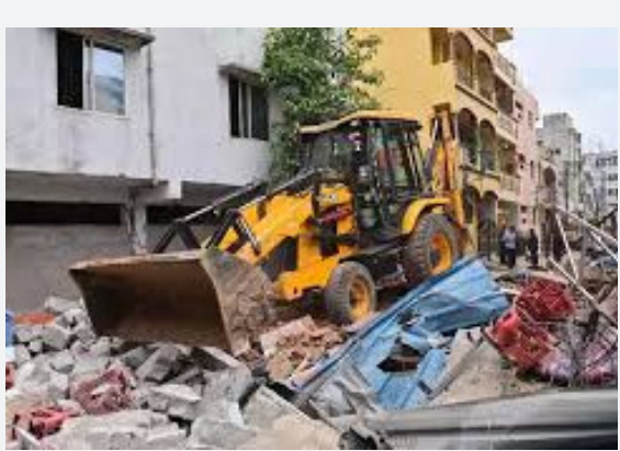
భగీరథమ్మ చెరువులో ఆక్రమణల కూల్చివేత