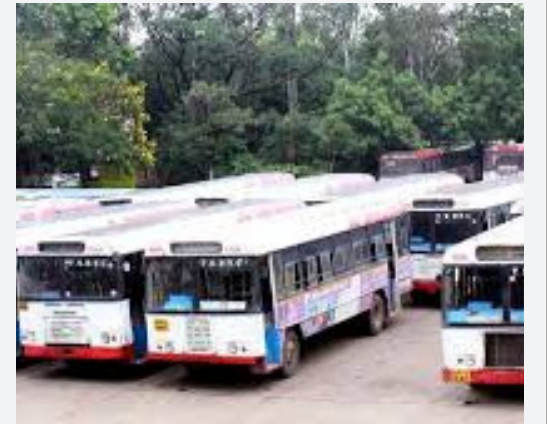
సంక్రాంతికి ప్రత్యేక బస్సులు