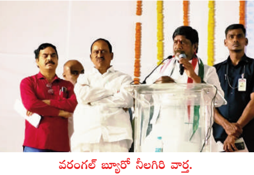
వరంగల్ జ్యూరీ సీలగిరి వార్త.