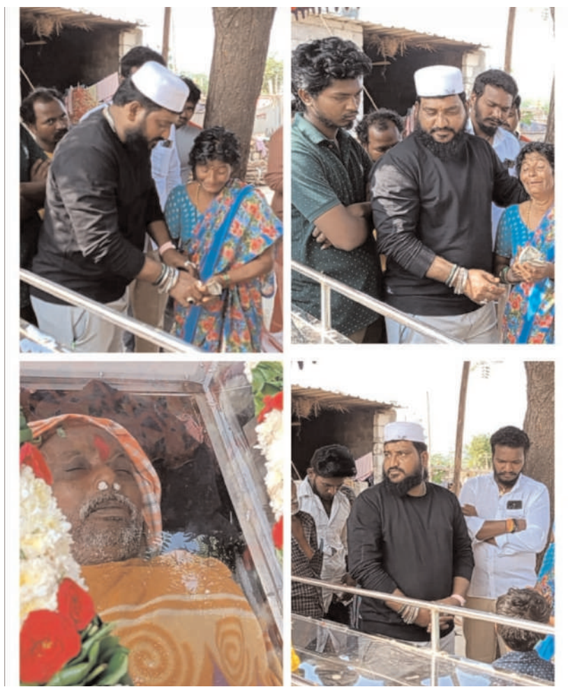
పెద్ద దోర్నాల సీలగిరి వార్త జనవరి 5.

సీట్ల దైవర్స్ యూనియన్ అడ్వర్షుడు షేక్షావలి అందజేత