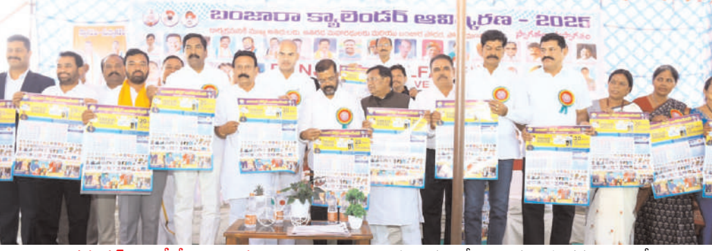
వరంగల్ జ్యూరో సీలగిరి వార్త.