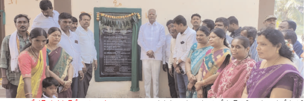
షేక్స్ పిర హుసేన్ సీలగిరి వార్త.