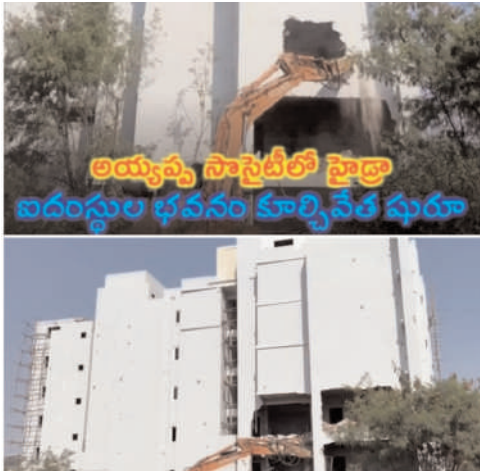
అయ్యప్ప సాసైటీలో హైద్రా ఐదంస్తుల భవనం కూల్చివేత ఘనం

మాదూరంలోని అయ్యప్ప సాసైటీలో అక్రమంగా నిర్మించిన ఐదంస్తుల భవనాన్ని హైద్రా కూల్చివేస్తోంది. శనివారం ఈ భవనాన్ని పరిశీలించిన హైద్రా చీఫ్ రంగనాథ్, ఇతర అధికారులు.. ఆదివారం ఉదయం భారీ బుల్డోజర్లతో వచ్చి కూల్చివేత పనులు ప్రారంభించారు. అయ్యప్ప సాసైటీలోని 100 ఫీట్ రోడ్ కు ఆనుకుని ఉన్న ఈ భవనం అక్రమ కట్టడమని హైద్రాతో పాటు హైకోర్టు కూడా ఇప్పటికే నిర్ధారించింది. బిల్డింగ్ యజమానికి గతేడాదే నోటీసులు జారీ చేసినట్లు జీపాచ్ఎంసీ అధికారులు తెలిపారు. ఈ నేపథ్యంలోనే హైద్రా అధికారులు ఆదివారం ఉదయం బిల్డింగ్ కూల్చివేత పనులు మొదలు పెట్టారు. మరోచెప్పు, సోమవారం నుంచి హైద్రాలో ప్రజావాణి కార్యక్రమం ప్రారంభం కానుంది. ప్రతి సోమవారం బుద్ధ భవన్ లో ఉదయం 11 గంటల నుంచి సాయంత్రం 5:30 గంటల వరకు ప్రజావాణి నిర్వహించనున్నారు. ప్రభుత్వ పార్కులు, స్థలాలు, చెరువులకు సంబంధించి అక్రమణలపై ప్రజల నుంచి నేరుగా ఫిర్యాదులు స్వీకరిస్తారు. ఫిర్యాదుదారులు ఆధారాలతో రాలాని హైద్రా సూచించింది. ముందుగా వచ్చిన 50 మందికి బోకెస్స్ ఇచ్చి.. దాని ప్రకారం ఫిర్యాదులు స్వీకరిస్తామని కమిషనర్ రంగనాథ్ తెలిపారు. మాదూరంలోని అయ్యప్ప సాసైటీలో అక్రమంగా నిర్మించిన ఐదంస్తుల భవనాన్ని హైద్రా కూల్చివేసింది. శనివారం ఈ భవనాన్ని పరిశీలించిన హైద్రా చీఫ్ రంగనాథ్, ఇతర అధికారులు.. ఆదివారం ఉదయం