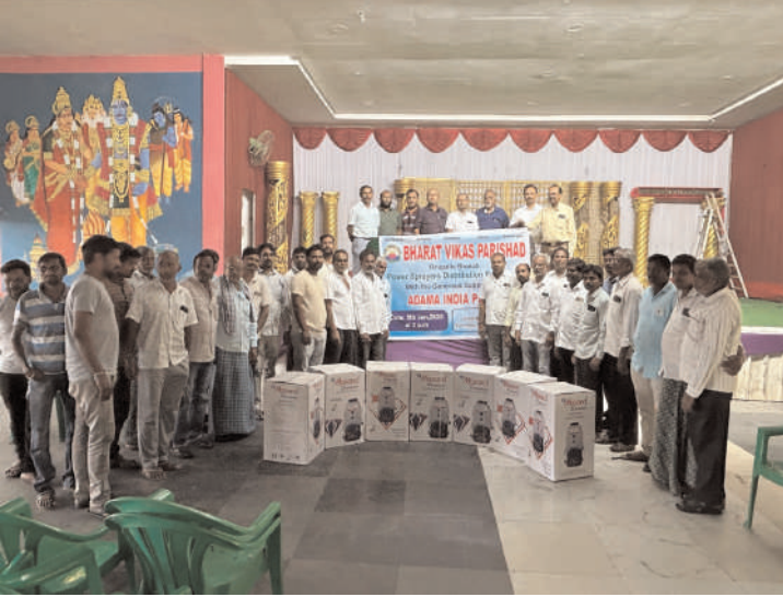
వరంగల్ జ్యూరో సీలగిరి వార్త.