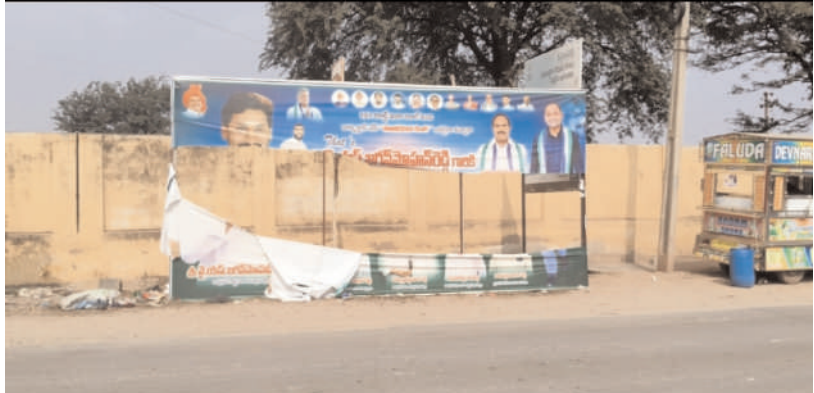
పెద్ద దోర్నాల సీలగిరి వార్త జనవరి 5.

ప్రకాశం జిల్లా పెద్ద దోర్నాల మండలం, దోర్నాలలో కృష్ణ సంస్కృతిక తెర లేపుతున్న గుర్తు తెలియని కొంతమంది వ్యక్తులు వైసిపి బ్యానర్లు ను చింపివేయడం పిరికిపందల చర్య అని ప్రజలంటున్నారు. దోర్నాల ప్రజలకు సూతన సంవత్సర శుభాకాంక్షలు తెలుపుతూ, మరియూ సంక్రాంతి పండుగ శుభాకాంక్షలు తెలుపుతూ వైసిపి అధ్యక్షులలో కట్టిన బ్యానర్లను చింపివేసి, పైశాచిక అనందం పొందుతున్నారు. మార్కెట్ యార్డ్ వద్ద, కరెంట్ ఆఫీసు ఎదురుగా, కట్టిన బ్యానర్లను చంపగలరే మో కానీ, ప్రజల గుండెల్లో గుడి కట్టుకున్న అభిమానాన్ని పోగొట్టలేరు కదా! అని ప్రజలు బాధపడుతున్నారు. వైసిపి బ్యానర్లను చింపి వేసిన వ్యక్తులపై కఠిన చర్యలు తీసుకోవాలని ప్రజలు కోరుతున్నారు.