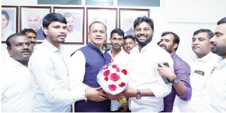
కూకట్ పల్లి జనపరి సీలగిరి వార్త