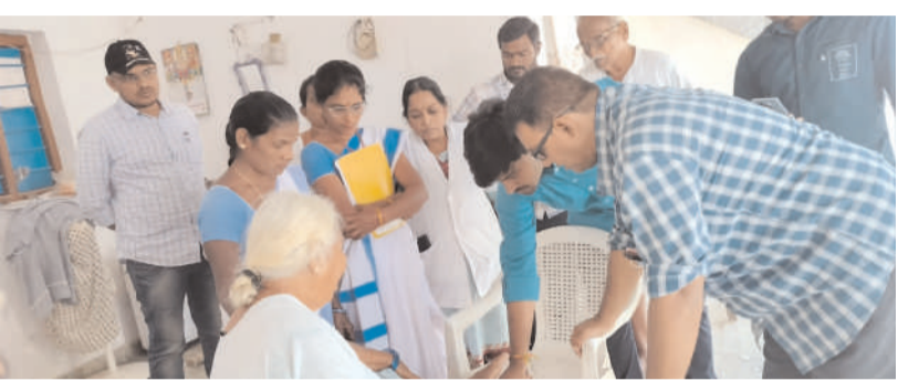
పెద్ద దోర్నాల నీలగిరి వార్త జనవరి 6.