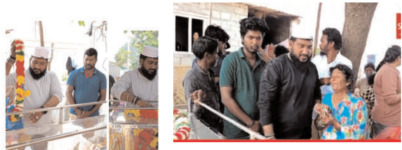
పెద్ద దోర్నాల నీలగిరి వార్త జనవరి 6