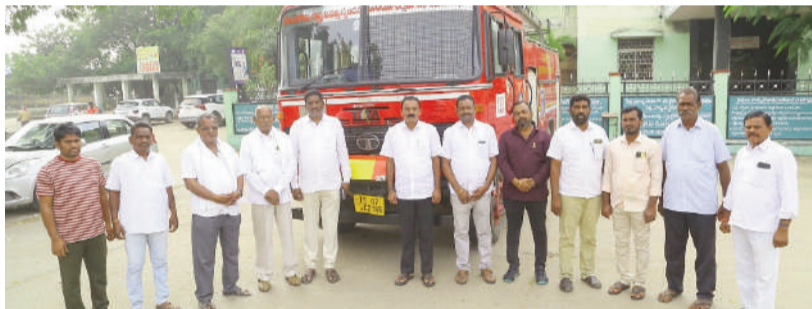
ఖమ్మం నీలగిరి వార్త బ్యూరో జనపతి 17