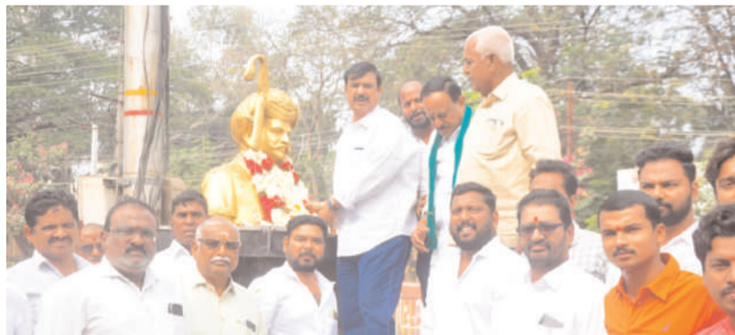
ఖమ్మం నీలగిరి వార్త బ్యూరో జనపతి 17