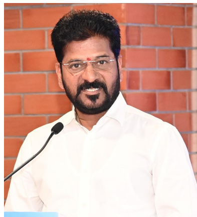
కొనియాడారు. దేశంలోనే తెలంగాణ, హైదరాబాద్ నగరం అత్యంత వేగంగా అభివృద్ధి చెందుతున్నాయని సీఎం రేవంత్ రెడ్డి అన్నారు.

వేగంగా అభివృద్ధి చెందుతున్న తెలంగాణ దేశ విదేశాల నుంచి అత్యధిక పెట్టుబడులు సాధించాలని, తెలంగాణ పని శ్రీలియన్ ఆర్థిక వ్యవస్థగా మార్చి ప్రయత్నం చేస్తున్నామని రేవంత్ ధిమా వ్యక్తం చేశారు.