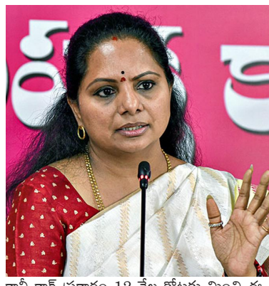
కానీ కాగ్ ప్రకారం 12 వేల కోట్లకు మించి ఈ ఏడాది ఆదాయం రాలేదన్నారు. మరి ఈ అబద్ధాలు అధికారంలోకి వచ్చిన కాంగ్రెస్ కనీసం ఇప్పుడైనా నిజాలు చెప్పాలని డిమాండ్ చేశారు.

పచ్చి అబద్ధాలతోనే సీఎం రేవంత్ రెడ్డి పాలన హైదరాబాద్ కు లాభపోయిన రియల్ ఎస్టేట్ రంగం రాష్ట్రంలో పడిపోతున్న ఆదాయం ఎమ్మెల్యే కవిత హైదరాబాద్- సీలగిరివార్త: రాష్ట్ర ప్రజలకు పడేపడే అబద్ధాలు చెబితే అవి నిజాలు అవిపోతాయని సీఎం రేవంత్ రెడ్డి ప్రమిత్తు న్నారని.. కానీ అలా ఎమ్మెల్యే కవిత ఎద్దేవా చేశారు.