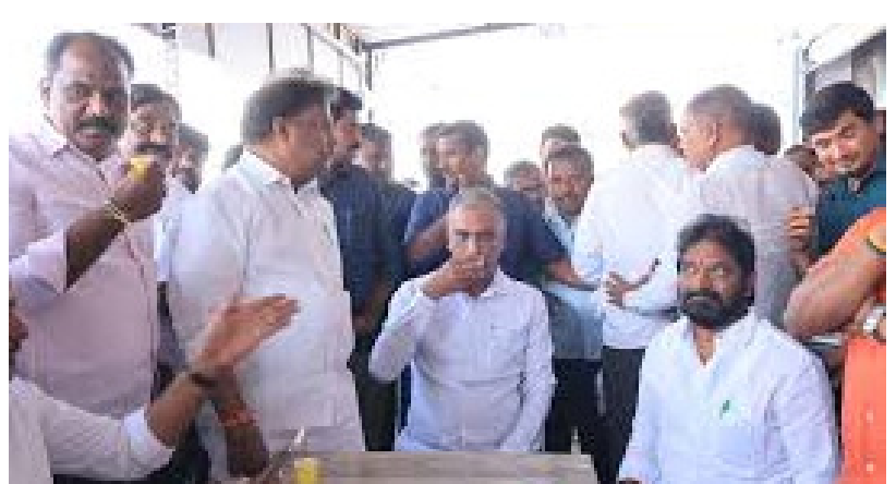
భూమి ప్రభుత్వం రూ. 3,900 కోట్లు ఖర్చు చేసింది. ఏపీ ప్రభుత్వం అక్రమంగా కృష్ణా జలాలు తరలించుకుపోతోంది.

నీటిని తరలించుకుపోతున్నా పట్టించుకోని వైపనం సారంగం పనుల్లో కానరాని పురోగతి ఆందోళనకు దిగిన బిఆర్ఎస్.. అడ్డుకున్న పోలీసులు ప్రభుత్వం తీరుపై మండిపడ్డ పార్టీ ఛాన్సెలర్ ను ఆరోపించారు.