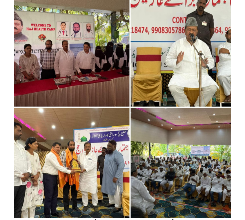
వెల్లడించారు. ఈ కార్యక్రమంలో హజ్ విజయవంతం చేశారు. కమిటీ సభ్యులు, జిల్లా నాయకులు, అధికారులు, పెద్ద సంఖ్యలో హజ్ యాత్రికులు పాల్గొని శిక్షణ శిబిరాన్ని