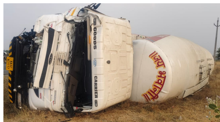
చిలకలడోన గ్రామంలో ఘోర వైబలనాగి రెడ్డి,టిడిపి

రోడ్డు ప్రమాదం, అసోక్ లైలాండ్ వాహనం,సిమెంట్ లోడ్ ట్రాంకర్ వాహనం ఢీ 10 మంది మృతి... ఈ ప్రమాదం పట్ల మంత్రాలయం ఎమ్మెల్యే