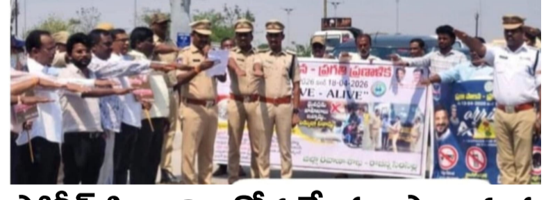
పోలీస్ సిబ్బంది ఆరోగ్యమే మా ప్రాధాన్యత