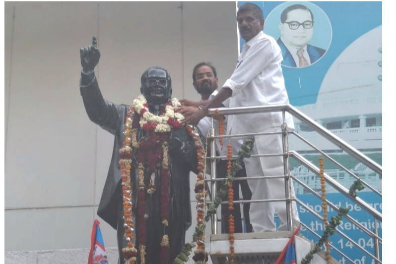
ప్రతినిధులు ఉన్నారు. ఈ పోరాటం రాజకీయ ఉనికిని చాటుకోవడానికేనని కేవలం రిజర్వేషన్ కోసమే కాదని, ఓబీసీ వారు స్పష్టం చేశారు.