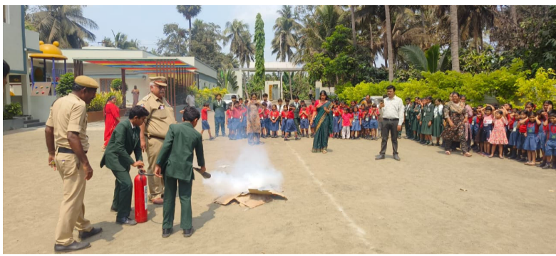
కొవ్వూరు నీలగిరి వార్త ప్రతినిధి