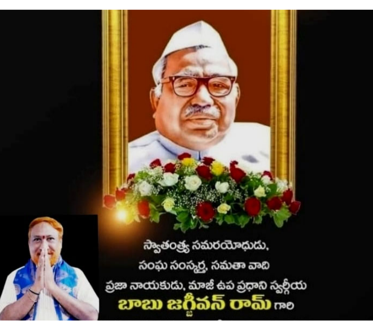
స్వాతంత్ర్య సమరయోధుడు, సంఘ సంస్కర్త, సమతా వాది ప్రజా నాయకుడు, మాజీ ఉప ప్రధాని స్వర్ణీయ బాబు జగ్జీవన్ రామ్ గారి