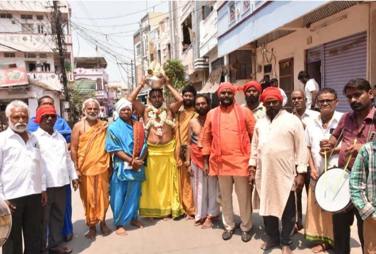
గ్రేటర్ వరంగల్ మున్సిపల్ కార్పొరేషన్ అధ్యక్షులలో.