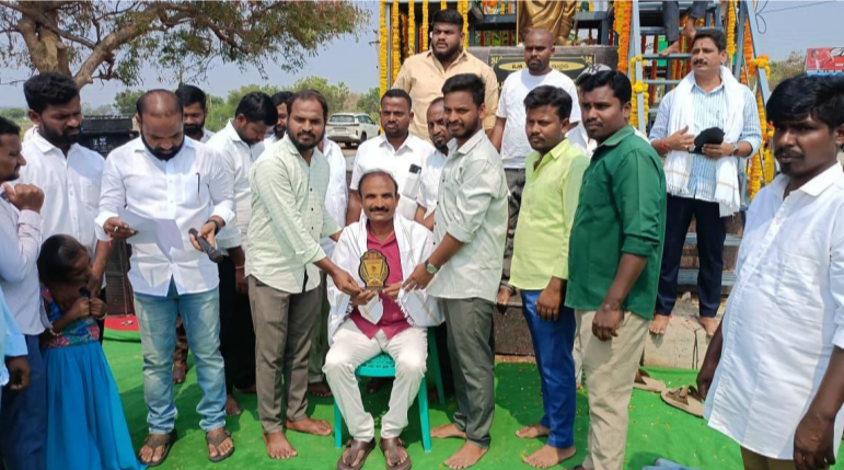
సిద్దిపేట జిల్లా ప్రతినధి, ఏప్రిల్ 05, నీలగిరి వార్త:

భారతదేశ మాజీ ఉప ప్రధాని స్వర్ణీయ బాబు జగ్జీవన్ రామ్ జయంతి సందర్భంగా సిద్దిపేట జిల్లా గజ్జెల్ వియోజకవర్గం దుద్దెడ గ్రామంలో ఆయన విగ్రహానికి ఆదివారం ఘనంగా నివాళులు అర్పించారు. ఈ సందర్భంగా అంబేద్కర్ సంఘ సభ్యులు, సర్పంచ్, ఉప సర్పంచ్,