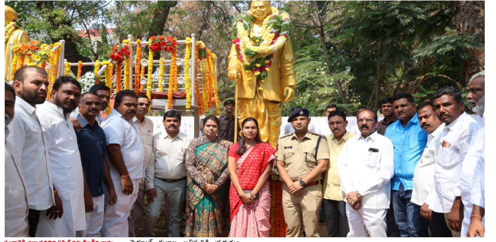
సంగారెడ్డి జిల్లా ప్రతినధి, ఏప్రిల్ 05, నీలగిరి వార్త: