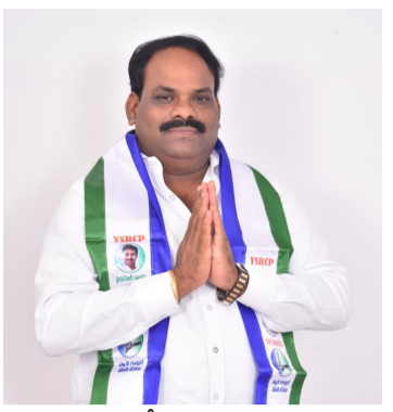
ప్రయోజనాల కోసం రాజధానిగా ఎంపిక చేసి రాష్ట్ర భవిష్యత్తును నాశనం చేశారన్నారు. ఇప్పటికైనా ఆలోచన చేసి బేసజాలకు పోకుండా తప్పనిసరి సరిదిద్దుకుని, ఇప్పటికే అన్ని సదుపాయాలు ఉండి తక్కువ ఖర్చుతో, సామాన్యులు కూడా నివసించగలిగే జగన్ ఆలోచన అని తెలియజేశారు

చాలామంది అపహాస్యం చేస్తున్నారు. కానీ అది భూవత్తర ప్రణాళిక. మచిలీపట్నం పోర్టును, రెండు ఇంటర్నేషనల్ ఎయిర్ పోర్ట్ లను, జాతీయ రహదారిని కలుపుకుంటూ సకల సదుపాయాలతో వర్షల్లో రాజధాని ఇది. కేవలం 20 వేల కోట్లతో చాలా తక్కువ సమయంలో దీన్ని నిర్మించగలం. రాష్ట్రం విడిపోయిన తరువాత చంద్రబాబు నాయుడు ముఖ్యమంత్రి అప్పటికి ఈ రాష్ట్రానికి దురదృష్టకరమైన చారిత్రాత్మక తప్పిదం అయినది అన్నారు. 2014లో వైయస్ జగన్మోహన్ రెడ్డి గెలిచినట్లైతే మన రాష్ట్రంలో ఇప్పటికే మంచి రాజధాని ఏర్పడి ఉండేది. ఆనాడు కేంద్ర ప్రభుత్వం నియమించిన శివరామకృష్ణ కమిటీ, మేధావుల సలహాలు పక్కనపెట్టి, రాష్ట్రంలోనే అద్భుతమైన పంట భూములను నాశనం చేసి, నిర్మాణాలకు అణచు గాని అమరావతి నీ స్వర్గ