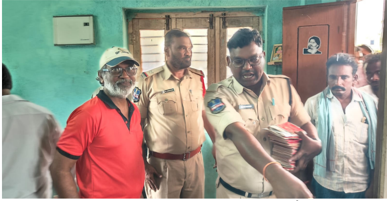
పోలీసుల పహారా నడుమ పంపిణీ నీలగిరి వార్త నేలకొండపల్లి మండలం..

ఖమ్మం జిల్లా నేలకొండపల్లి మండలం లో గ్యాస్ బండలు పంపిణీ పక్రియ రోజు రోజుకు ఉద్దిగ్రతంగా మారుతుంది. చివరకు పోలీసుల పహారా నడుమ గ్యాస్ బండలు పంపిణీ జరిగింది. వివరాలు ఇలా ఉన్నాయి. మండల కేంద్రంలో గ్యాస్ బండలను మంగళవారం పంపిణీ ప్రక్రియను చేపట్టారు. కాగా ఏజెన్సీ వారికి కేవలం