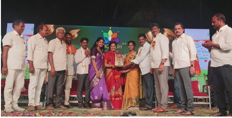
కొవ్వూరు నీలగిరి వార్తా ప్రతినది

కొవ్వూరు : విద్య అనేది పాఠ్యపుస్తకాలకే పరిమితం కాకుండా సంపూర్ణమైన వికాసవంతమైన వాతావరణంలో అత్యుత్తమ ప్రమాణాలను అనుసరిస్తూ వెలుగులతో కూడిన విద్యను అందిస్తున్న ఇంటర్నేషనల్ డిల్లీ పబ్లిక్ స్కూల్ యాజమాన్యం ఆధీనంలోని యువని రాజమహేంద్రవరం పార్లమెంట్