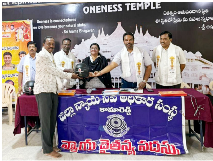
ఐవిఎఫ్ మరియు కామారెడ్డి రక్షదాతల సమూహ సేవలు అభినందనీయం

కామారెడ్డి జిల్లా ప్రతినిధి: నీలగిరి వార్త: