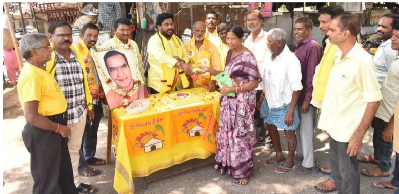
వరంగల్ బ్యూరో నీలగిరి వార్త