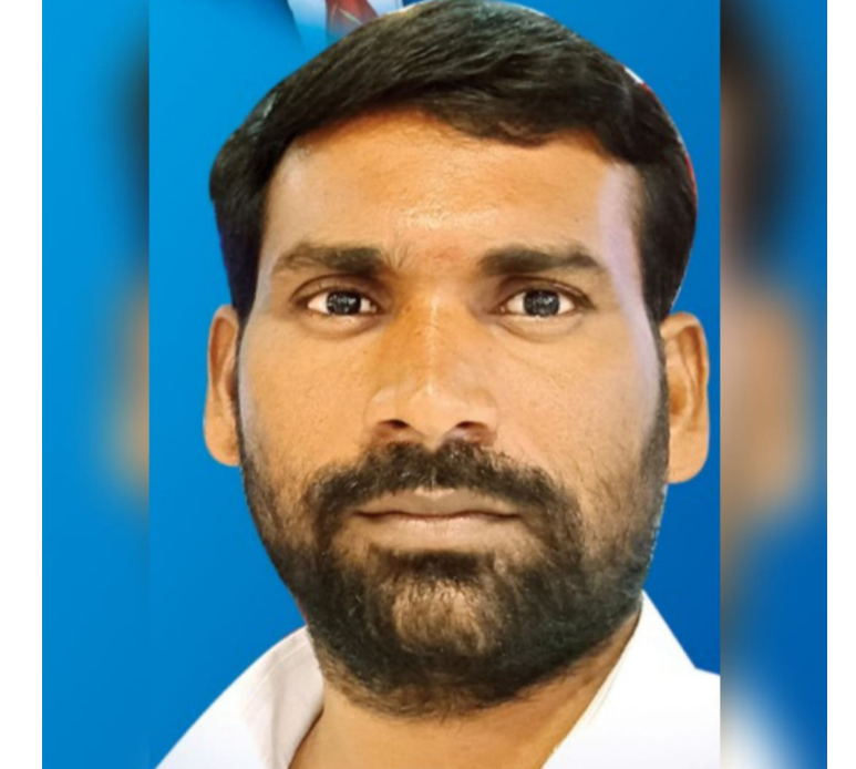
తీసుకురావాలి. ఎదురుచూస్తున్న పేదలు మేము విజ్ఞప్తి చేస్తున్నాం, మరోచెప్ప... ఈ పరిస్థితి సమాజానికి మంచిది కాదు. కాబట్టి ప్రస్తుత కాంగ్రెస్ ప్రభుత్వం మానవతా దృక్పథంతో స్పందించి, వెంటనే చర్యలు తీసుకోవాలని

మాత్రమే కాదు పేదల ఆశలు, కన్నీళ్లు, జీవితాల నిర్లక్ష్యం కూడా, రోజు కూడా వేలాది నిరుపేద కుటుంబాలు అద్దె ఇళ్లలో కష్టాలు పడుతున్నాయి. వర్షం పడితే పైకప్పు కారే ఇళ్లు, విద్యుత్ లేని గుడిసెలు, భద్రత లేని నివాసాల్లో జీవిస్తున్నారు. అలాంటి అర్జులైన కుటుంబాలకు ప్రభుత్వం వెంటనే ఈ డబుల్ బెడ్రూమ్ ఇళ్లను కేటాయించాలి. ప్రస్తుత కాంగ్రెస్ ప్రజా ప్రభుత్వం "ప్రజల ప్రభుత్వం" బన నిజంగా ప్రజల పక్షాన నిలవాలంటే, ముందుగా పేదల గృహ సమస్యను పరిష్కరించాలి. గత ప్రభుత్వం నిర్మించిన ఇళ్లను రాజకీయ కోణంలో చూడకుండా, ప్రజల అవసరాల కోణంలో చూడాలి. తెలంగాణ అంబేద్కర్ యువజన సంఘం తరఫున ప్రభుత్వంపై కోరుతున్నాము నిర్మాణం పూర్తయి ఖాళీగా ఉన్న ఇళ్లను అర్జులైన పేదలకు పారదర్శకంగా కేటాయించాలి. రాజకీయ సిఫార్సులు, అవినీతి లేకుండా నిజమైన పేదలకే ప్రాధాన్యత ఇవ్వాలి. దళితులు, బీసీలు, గిరిజనులు, వికలాంగులు, ఒంటరి మహిళలు వంటి బలహీన వర్గాలకు ప్రత్యేక ప్రాధాన్యం ప్రాధాన్యం మరలమొనరించే మరమ్మతులు చేసి వినియోగంలోకి