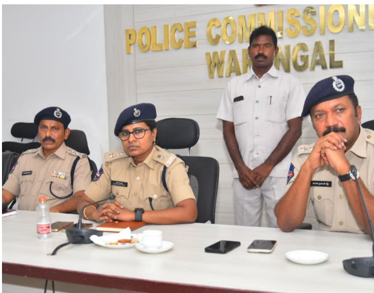
సెంట్రల్ జోన్ డీసీపీ దార కవిత్.