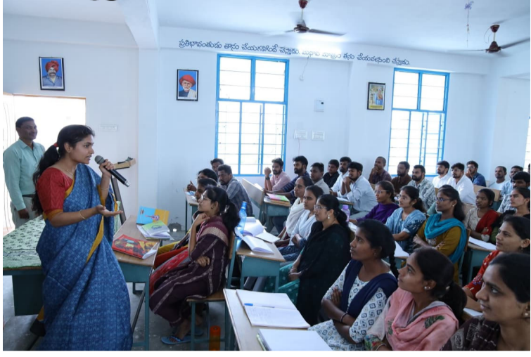
హనుమకొండ జిల్లా కలెక్టర్ చాహాట్ బాజ్ పాయి.