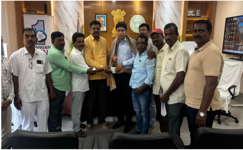
నల్గొండ నీలగిరివార్త: ఏప్రిల్ 30