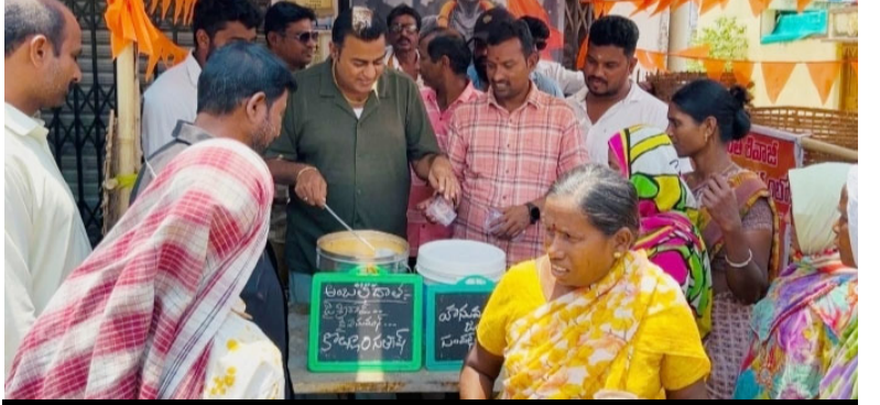
అంబలిని అందజేస్తున్న చిత్రపతి శివాజీ సభ్యులు