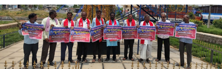
నూకలమర్రి ప్రాథమిక పాఠశాల ఉపాధ్యాయులు అందరూ కలిసి డోర్ టు డోర్ బడిబాట కార్యక్రమం