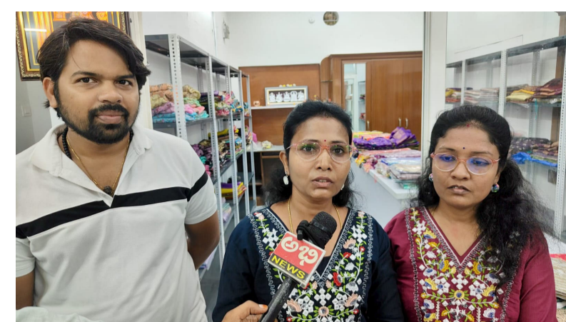
సరికొత్త కలెక్షన్లు అందుబాటులోకి వస్తాయని ఆమె ఈ సందర్భంగా వివరించారు. తక్కువ బడ్జెట్లో నాణ్యమైన వస్త్రాల కోసం తమ షోరూమ్ ను సందర్శించాలని ఆమె కోరారు. మరిన్ని వివరాలకు 7095207520 నంబర్ లో సంప్రదించవచ్చని తెలిపారు. ఈ కార్యక్రమంలో కుటుంబ సభ్యులు, బంధుమిత్రులు, స్థానిక మహిళలు, తదితరులు పాల్గొన్నారు.

కేవలం రూ.150 నుండి రూ. 5,000 వరకు వివిధ రకాల చీరలు అందుబాటులో ఉన్నాయని వివరించారు. పట్టు, సెమీ పట్టు, పట్టోల, డోలా సిల్క్ మరియు డిజిటల్ ప్రింట్ చీరలతో పాటు డ్రెస్ మెటీరియల్స్ కూడా ఇక్కడ లభిస్తాయని చెప్పారు. ప్రత్యేకించి బయట మార్కెట్లో పదివేల రూపాయల వరకు పలికే వన్ గ్రామ్ గోల్డ్ చీరలను, ఇక్కడ కేవలం రూ. 2,500 నుండి రూ. 3,000 లోపే అందిస్తున్నామని ఆమె వెల్లడించారు. నేతతో చిన్నపాటి పొరపాట్లు (వీవింగ్ మిస్క్) ఉన్న చీరల కోసం ప్రత్యేక సెక్షన్ ను ఏర్పాటు చేశామని, బయట రెండు వేల రూపాయలు ఉండే ఇటువంటి చీరలను కేవలం రూ. 500 నుండి రూ. 700 లకే విక్రయిస్తున్నామని ఆమె తెలిపారు. వినియోగదారులు నేరుగా వచ్చి తమకు నచ్చిన వస్త్రాలను పరిశీలించి కొనుగోలు చేయవచ్చని, ప్రత్యేక