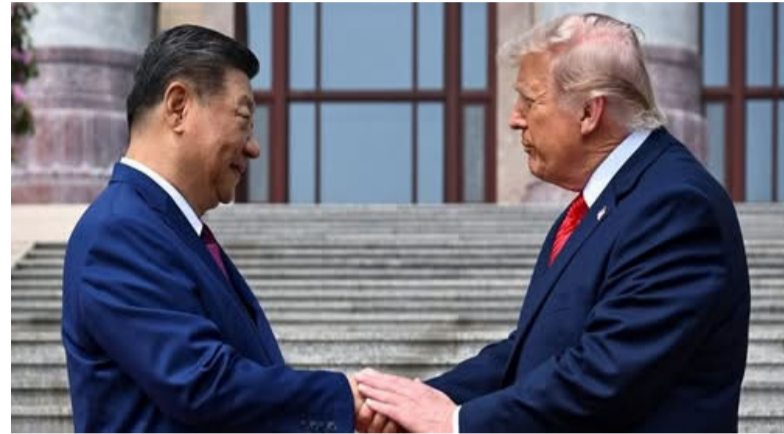
జిన్, మే 14 నీలగిరివార్త అమెరికా అధ్యక్షుడు డొనాల్డ్ ట్రంప్, చైనా అధినేత జిన్ పింగ్ మధ్య గురువారం టీజింగ్ లో ఉన్నత స్థాయి సమావేశం ప్రారంభమైంది. ...మిగతా 2 లో...