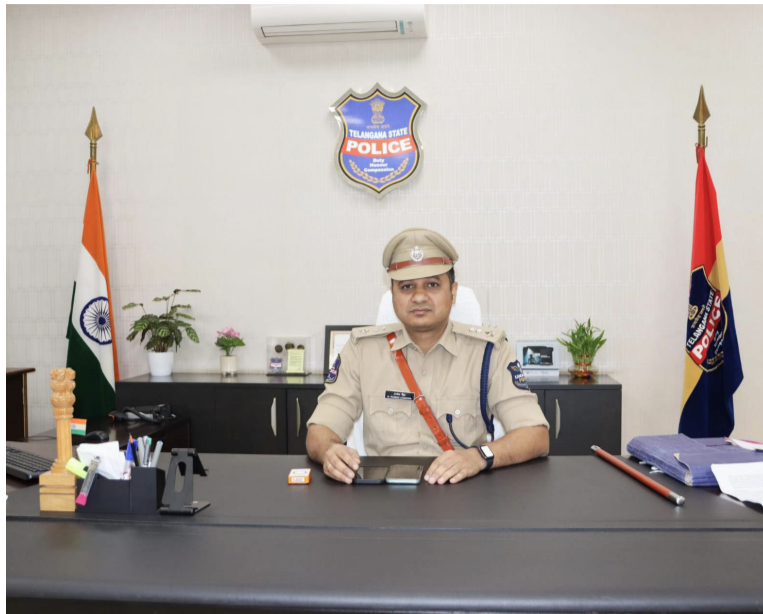
పరస్పర గౌరవం, సోదరభావంతో బక్రీడ్ పండుగను ప్రశాంత వాతావరణంలో జరుపుకోవాలని పిలుపునిచ్చారు. సమాచారం అందించే వారి వివరాలు రహస్యంగా ఉంచబడతాయని, ప్రజలందరూ పోలీసులతో సహకరించి జిల్లాలో శాంతిని కాపాడాలని జిల్లా ఎస్పీ యం. రాజేష్ చంద్ర కోరారు.

నిరంతర పర్యవేక్షణ కొనసాగిస్తున్నట్లు ఎస్పీ వివరించారు. చట్టాన్ని ఎవరూ తమ చేతుల్లోకి తీసుకోకూడదని, వాహనాలను ఆపడం లేదా తనిఖీలు నిర్వహించే అధికారం కేవలం ప్రభుత్వ విభాగాలకు మాత్రమే ఉంటుందని ఎస్పీ స్పష్టం చేశారు. వ్యక్తులు లేదా సంస్థలు స్వయంగా తనిఖీలకు దిగడం పూర్తిగా నిషేధమని, అలాంటి చర్యలకు పాల్పడే వారిపై చట్టపరంగా కఠినంగా వ్యవహరిస్తామని తెలిపారు. ప్రజలు ఎక్కడైనా అనుమానాస్పద స్థితిగతులను గమనించినట్లయితే స్వయంకృత చర్యలకు పాల్పడకుండా, వెంటనే 8712686133 హెల్ప్ లైన్ నంబర్ లేదా అత్యవసర సహాయం కోసం డయల్ 100కు ఫోన్ చేసి పోలీసులకు సహకరించాలని ఆయన విజ్ఞప్తి చేశారు. సోషల్ మీడియా వేదికలపై ద్వేషపూరిత, రెచ్చగొట్టే లేదా మత సామరస్యాన్ని దెబ్బతీసే పోస్టులు, వీడియోలు ప్రచారం చేసే వారిపై పోలీసు నిఘా ఉంటుందని, అటువంటి వారిపై చట్టపరమైన చర్యలు తప్పవని ఎస్పీ హెచ్చరించారు. జిల్లా ప్రజలందరూ