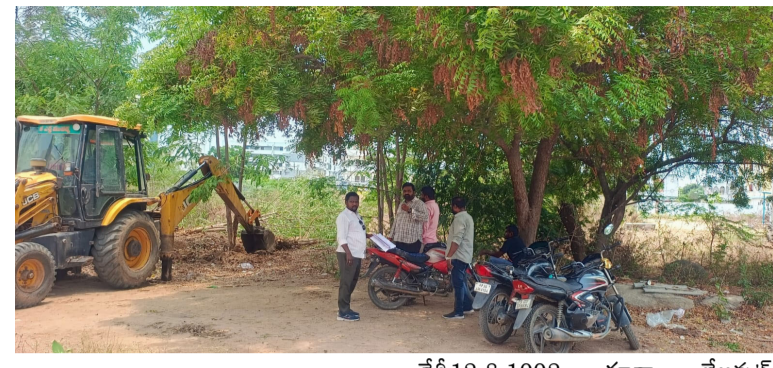
భూకబ్జాదారుల ప్రయత్నాలను ఆడ్డుకోవాలని కాలనీవాసుల విజ్ఞప్తి.