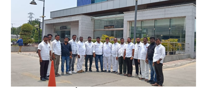
కాంగ్రెస్ నాయకులు వెళ్లి సంఘీభావం తెలిపారు.