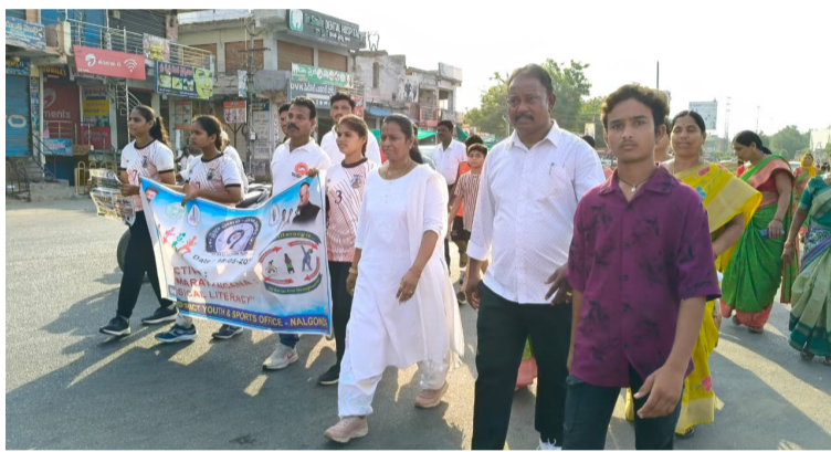
దేవరకొండ నీలగిరి వార్త

అంబేద్కర్ విగ్రహం వరకు సాగిన రన్ హాజరైన మున్సిపల్ చైర్మన్, అధికారులు, స్టార్ట్ అసోసియేషన్ యువత