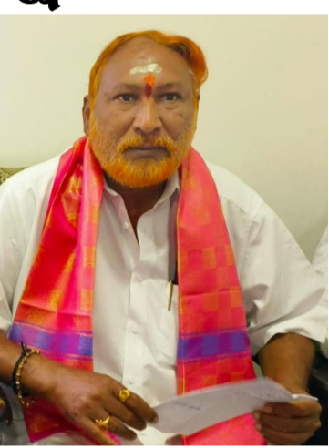
కోటా దక్షిణమండలం కోసమేనని నరేందర్ స్పష్టం చేశారు.

బీసీలకు 27 శాతం రిజర్వేషన్లు కల్పిస్తూ జీవో ఇస్తే, కోర్టుల ద్వారా 1993 వరకు అమలు కాకుండా అడ్డుకున్నారుని గుర్తు చేశారు. అదేవిధంగా 2018లో కేసీఆర్ సర్కార్ స్థానిక ఎన్నికల్లో కల్పించిన రిజర్వేషన్లను, ఇటీవల రేవంత్ రెడ్డి సర్కార్ జీవో 9 ద్వారా స్థానిక సంస్థల ఎన్నికల్లో బీసీలకు కల్పించిన 42 శాతం రిజర్వేషన్లను సైతం కోర్టుల ద్వారా అడ్డుకోవడం వెనుక పెద్ద కుట్ర దాగి ఉందన్నారు. తాము చేస్తున్న ఈ పోరాటం ఏ ప్రభుత్వానికీ, ఏ పార్టీనికీ లేదా మతానికి వ్యతిరేకం కాదని... కేవలం బీసీల హక్కులు సాధన కోసం, ఆత్మగౌరవం కోసం మరియు జనాభా దామాషా ప్రకారం అన్ని రంగాల్లో వాటా-