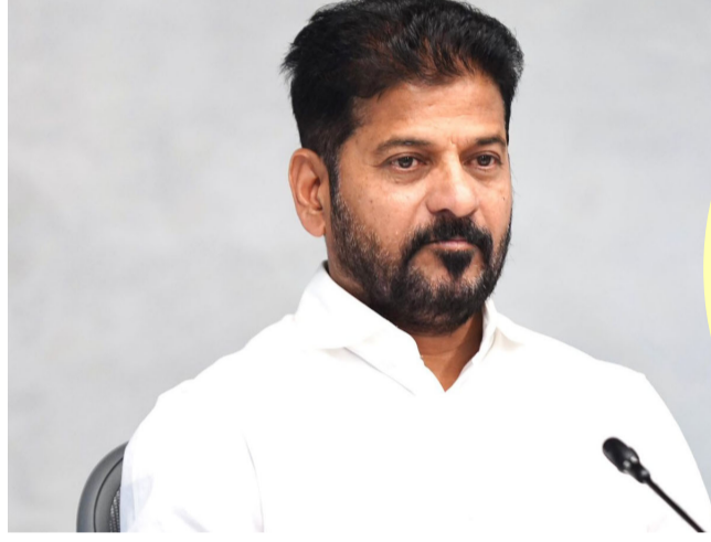
హైదరాబాద్, మే 21 నీలగిరి వార్త:

కార్మికులకు తెలంగాణ ముఖ్యమంత్రి రేవంత్ రెడ్డి శుభవార్త చెప్పారు. కనీస వేతనాలను పెంచుతూ నిర్ణయం తీసుకున్నారు. ఈ మేరకు రాష్ట్ర సచివాలయంలో మోడీయా సమావేశం ఏర్పాటు చేసి కీలక విషయాలను వెల్లడించారు. కార్మికుల కనీస వేతనాలపై ప్రభుత్వం నిర్ణయం తీసుకుందని సీఎం రేవంత్ తెలిపారు. గత ప్రభుత్వ నిర్ణయంతో 1.11 కోట్ల మంది కార్మికులు నష్టపోయారు. అందుకే ఉప ముఖ్యమంత్రి భట్టి