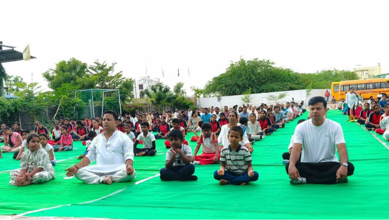
నీలగిరి వార్త కరీంనగర్